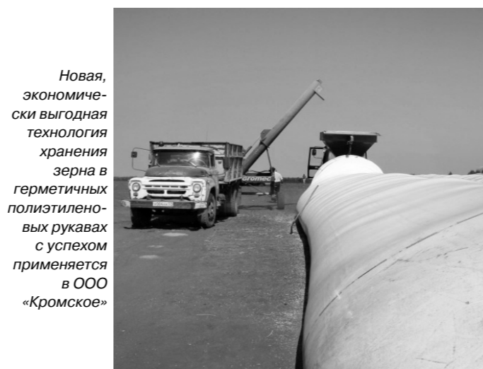
Новая, экономически выгодная технология хранения зерна в герметичных полиэтиленовых рукавах с успехом применяется в ООО «Кромское»

Что касается перерабатывающей промышленности в районе, то она представлена целым рядом предприятий. Многие жители Кромского района и гости уверены, например, что хлеб местного хлебозавода — самый вкусный по сравнению с тем, что им приходилось пробовать. В нынешнем году хлебозавод,