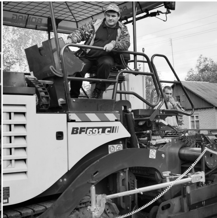
Новая техника в «Римексе». На предприятии приобретено немало единиц дорожной техники для ремонта и строительства автодорог в районе и в районном центре

становок позволяет сделать производство максимально экологичным и энергосберегающим. Управление всей установкой централизовано и осуществляется с пульта управления, размещенного в кабине оператора. Кабина оператора оборудована кондиционером и громкоговорящей связью.