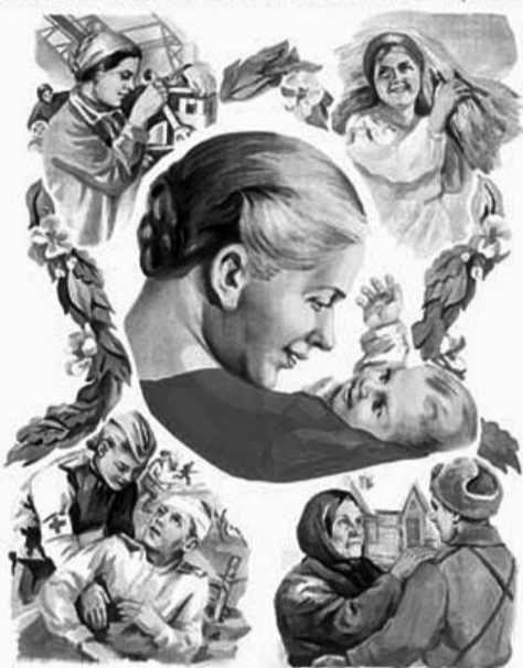
Ради жизни на земле...