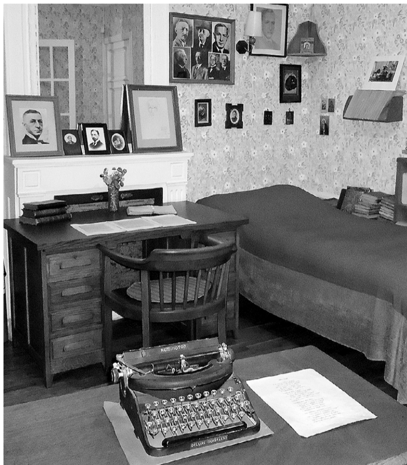
Рабочий кабинет писателя

поселился в Орле, поступив на службу в редакцию газеты «Орловский вестник». Бунин вспоминал: «С осени /1889 года/ стал работать при «Орловском вестнике» и был всем, чем придётся, — и корректором, и передовиком, и театральным критиком...». Орловский период в жизни Бунина связан с началом его профессиональной литературной деятельности. На страницах газеты и в столичных журналах публикуются его стихи и проза. В 1891 году в Орле вышел первый поэтический сборник Бунина «Стихотворения 1887—1891 гг.».