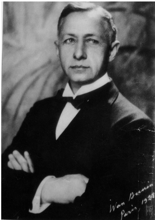
В музее хранятся подлинные вещи писателя

Многие бунинские реликвии были получены из-за рубежа. Фотографии из семейного альбома Буниных и книги из их личной библиотеки передала вдова писателя Вера Муромцева-Бунина. В 1973 году писательница Наталья Котлянская переслала из Парижа в Орёл мемориальную мебель из парижского кабинета Бунина. В 1988 году из Эдинбурга (Шотландия) через академика Дмитрия Лихачёва от Милицы Грин были получены портреты, книги, личные вещи Бунина: серебряные подстаканник, бювар, солонка, поднос, на котором писателю преподнесли хлеб-соль в день вручения ему Нобелевской премии в Стокгольме. В 1990-е годы американский буниновед профессор Сергей Крыжицкий в течение