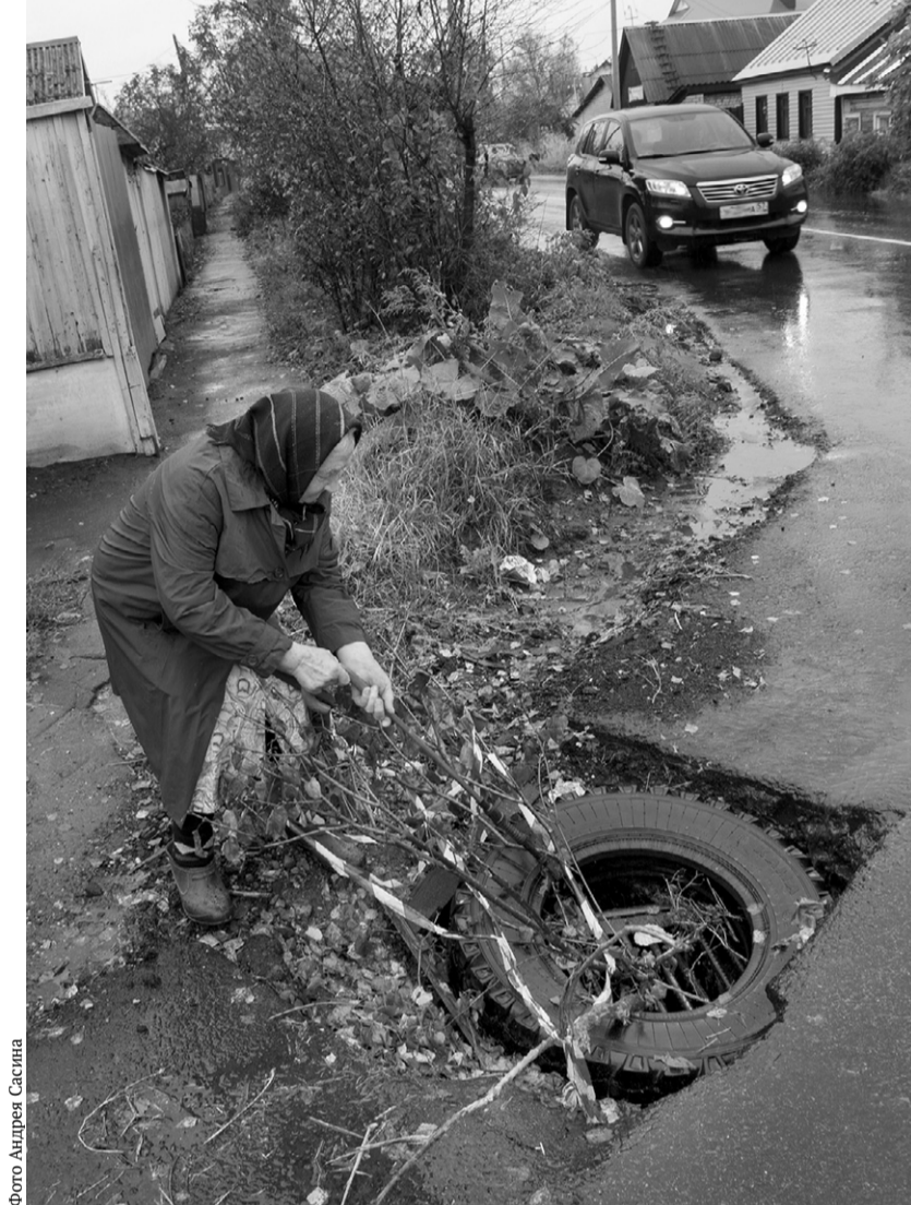
Ливнёвка без решётки — ловушка для водителей