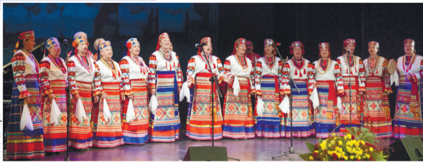
Песни родной Орловщины

нишь?..», «А вот здесь было по-другому!»