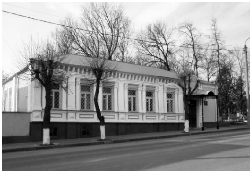
Музей И. А. Бунина в Орле

Восемнадцатилетним юношей начинающий поэт покинул разорившуюся до нищеты родительскую усадьбу и на несколько лет