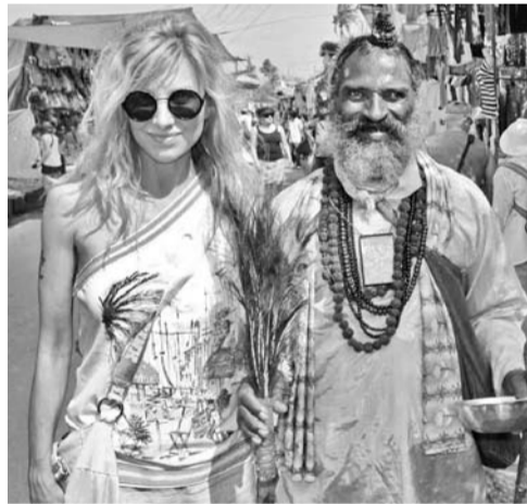
На улицах города Панаджи, столицы штата Гоа, можно встретить много колоритных персонажей. Некоторые из них — настоящие гуру