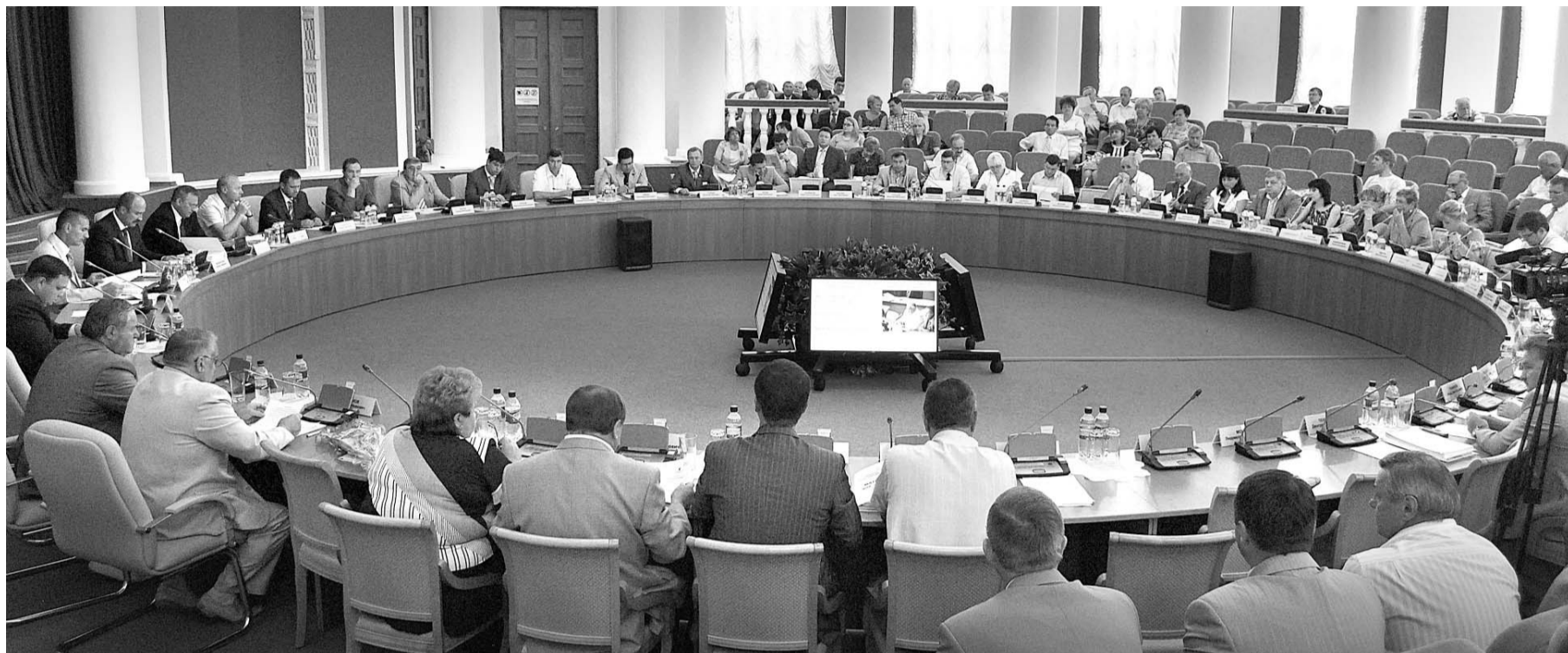
Круглый зал Дома Советов, где проходила сессия облсовета

НАПРАВЛЕННЫ НА РАЗВИТИЕ СОЦИАЛЬНОЙ СФЕРЫ ОРЛОВЩИНЫ