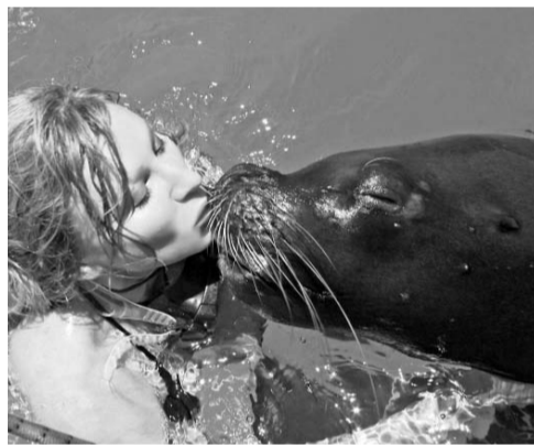
Поплывать с морским львом — большое удовольствие