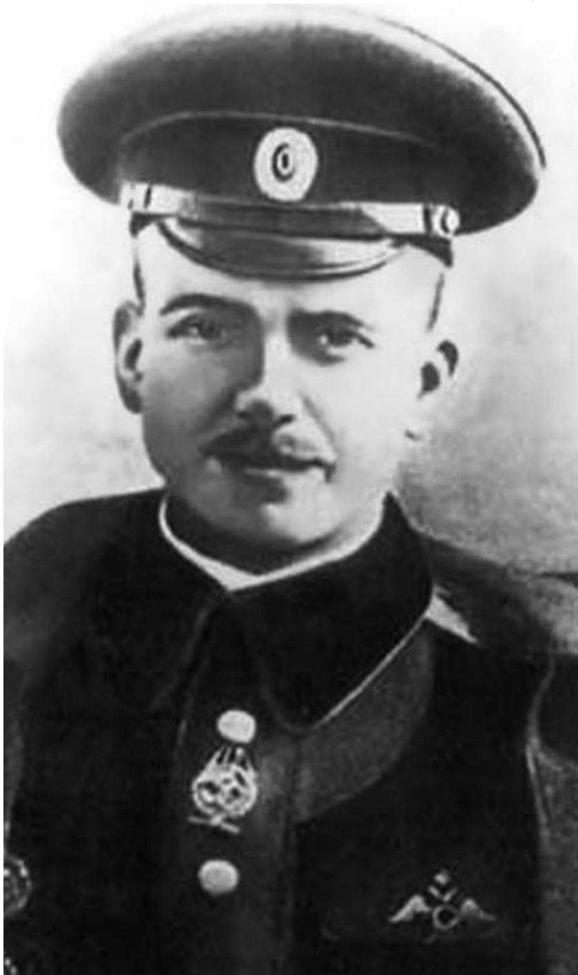
Пётр Николаевич Нестеров

КАК ОРЛОВСКАЯ ПОЛИЦИЯ ОБЕРЕГАЛА ЧЕСТЬ ГЕРОЯ-ЛЁТЧИКА