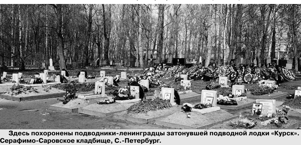
Здесь похоронены подводники-ленинградцы затонувшей подводной лодки «Курск». Серафимо-Саровское кладбище, С.-Петербург.