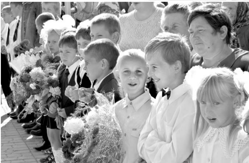
Плосковская школа — целый комплекс: учебное заведение, ка, спортивный центр... Накануне выступал на заседании Президиума