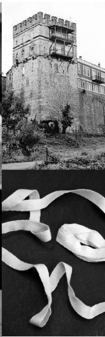
Священная обитель Ватопед на горе Афон, где хранится пояс Богородицы