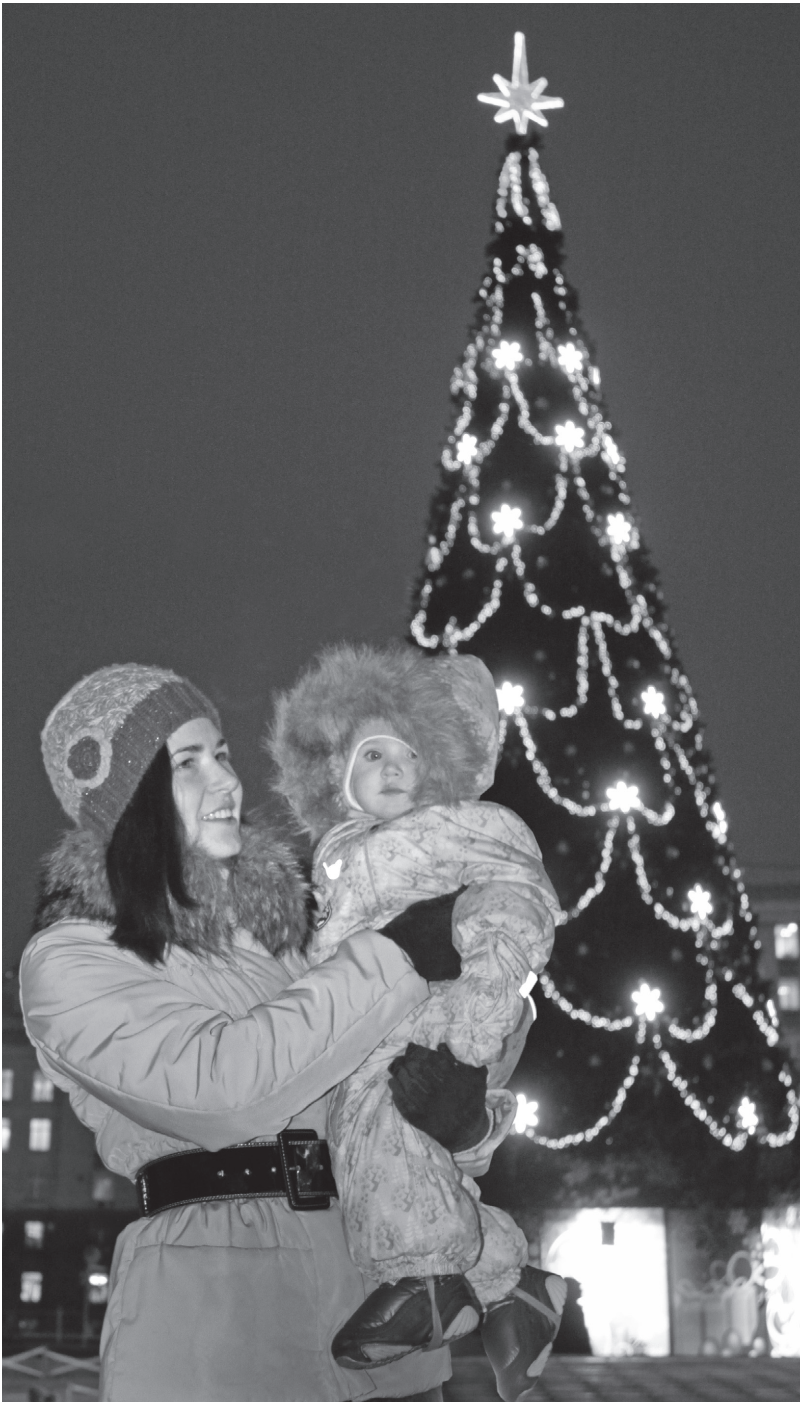
Высота главной ёлки города — 20,5 метра

Создавать праздничное новогоднее настроение орловцам зеленая красавица будет по традиции до 14 января.