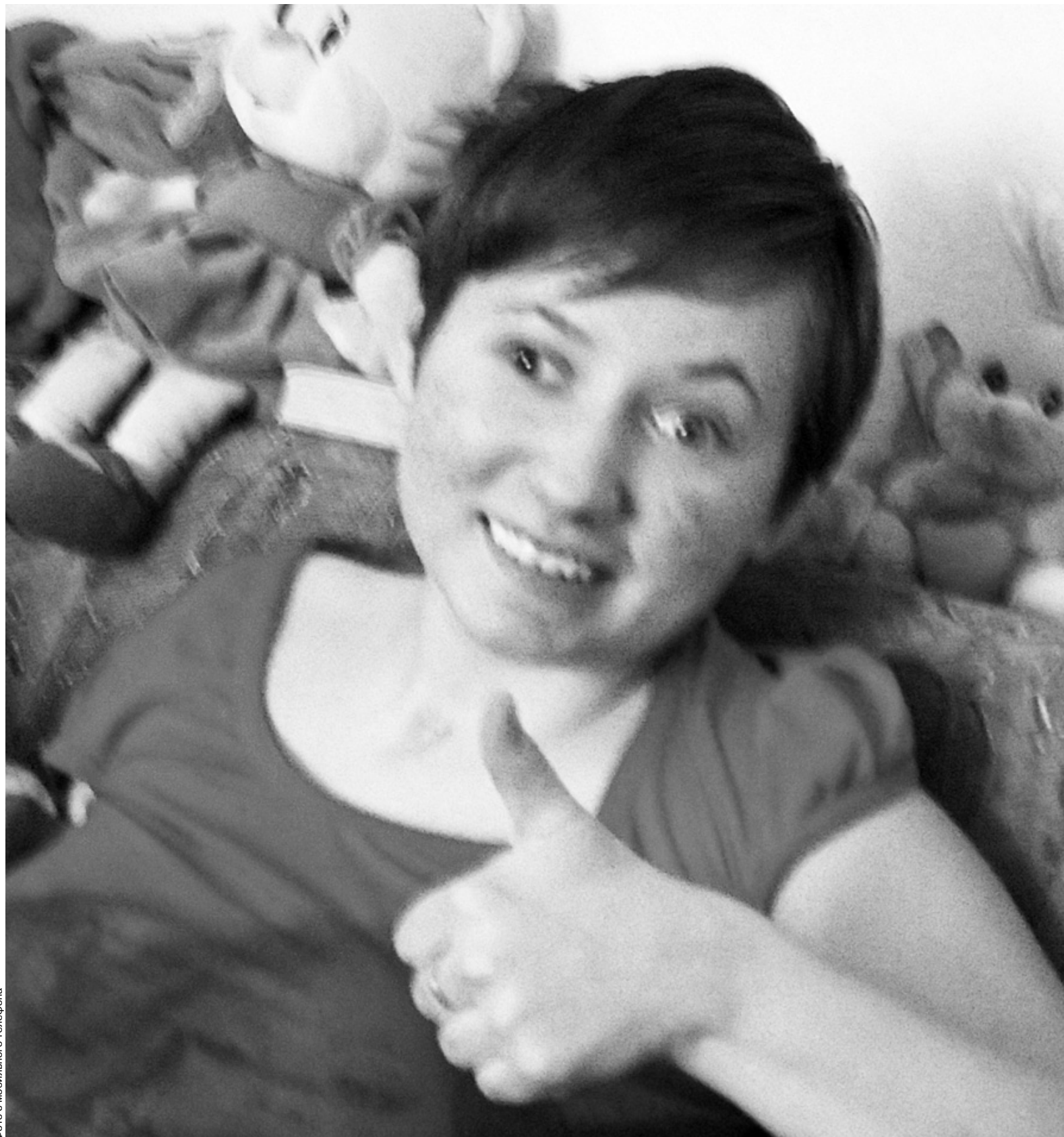
Фото с мобильного телефона