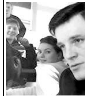
По сообщениям информантов.

В ходе опытов ученые установили, что у небольшого количества людей — 0,002 процента населения Земли — есть невероятная способность чувствовать ложь. При этом их уровень эффективности превосходит самые современные детекторы лжи, которые сейчас широко используются спецслужбами и даже судами. Пока еще не ясно, каким образом они определяют, обманывает человек или нет: по выражению лица, жестам, общему поведению или по признакам, относящимся к подсознанию. Обладающие данной способностью люди чувствуют ложь даже по видеозаписям.