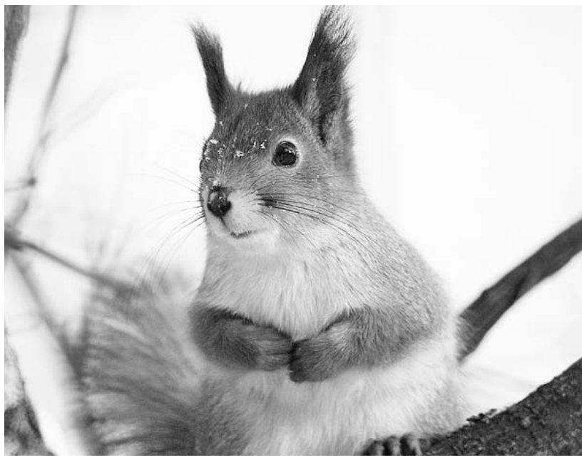
Фото Л. Климкиной, г. Орел.

Наш адрес: 302000, г. Орел, ул. Брестская, 6, к. 33.