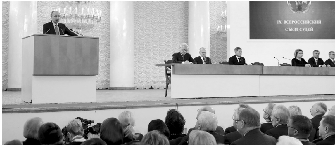
Владимир Путин: — Судья должен быть примером объективности, неподкупности и безупречности в своих действиях и решениях

В его работе приняли участие 780 делегатов: представители высших российских судов, федеральных судов общей юрисдикции, арбитражных и военных судов, мировые судьи, представители конституционных (уставных) судов субъектов РФ.