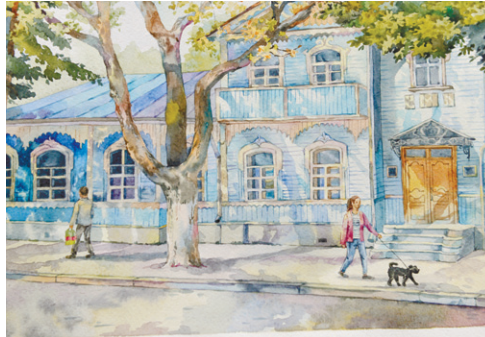
Анастасия Оксенюк. «На старых улочках Орла»