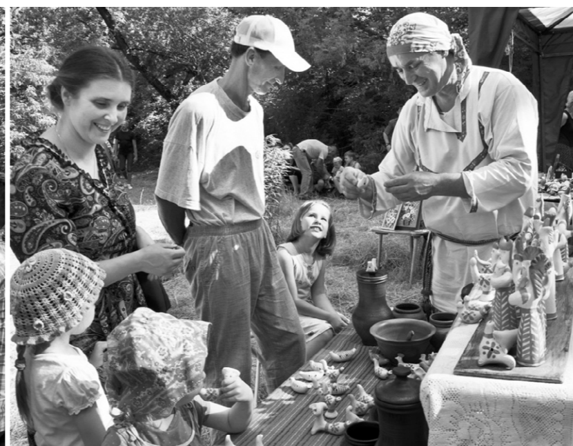
Ни один мастер не остался без внимания