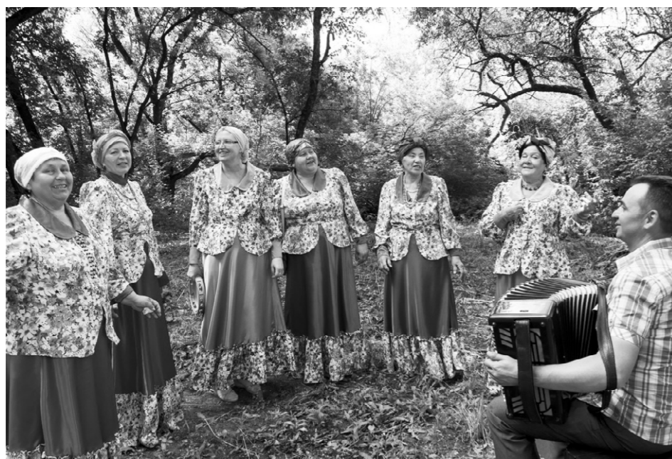
Льётся на просторе песня