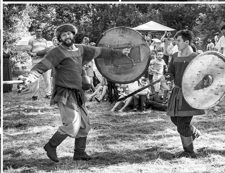
И снова бой

В празднике приняли участие богатыри Знаменской богатырской заставы. Они обучали гостей фестивалю ратному и морскому делу. На протяжении всего праздника дети и молодёжь участвовали в традиционных играх и забавах.