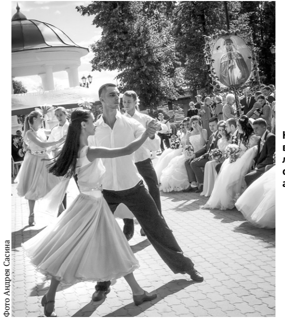
На празднике выступили лучшие орловские артисты