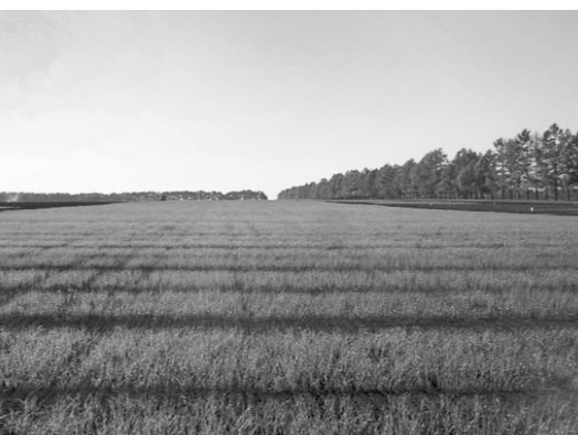
Хлебные поля Шатиловки

Что касается элитных и суперэллитных семян любых культур, стоят они недешево. Покупать их каждый