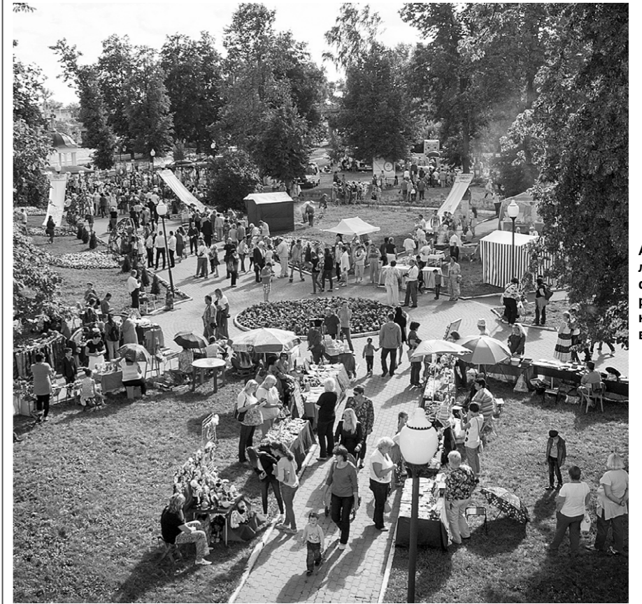
Аллея любви — самое романтическое место в городе