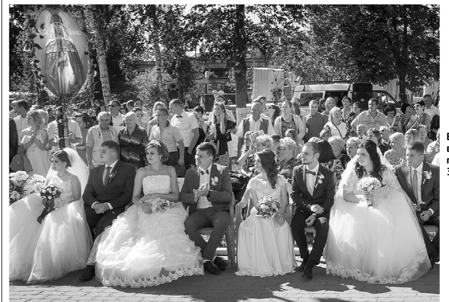
В этот день в Орле поженились 36 пар