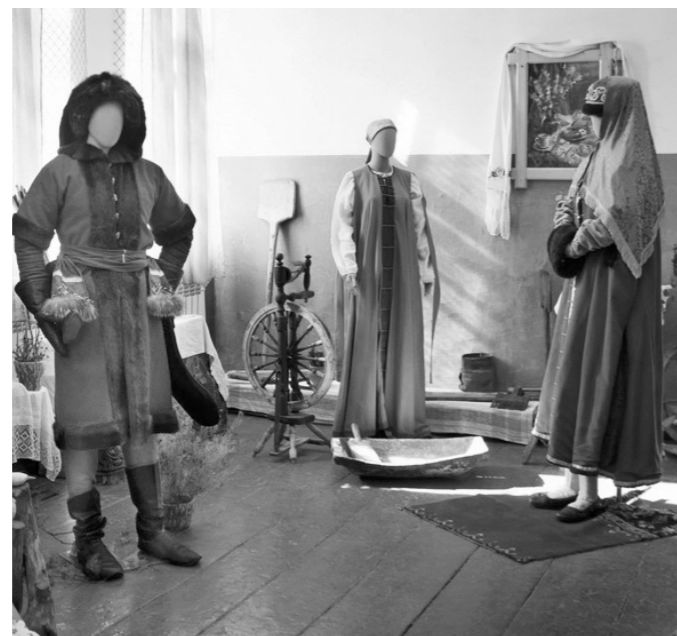
Так одевались в старину

Зрители фестиваля, организованного Орловским областным центром народного творчества и православной школой во имя святителя Николая Чудотворца с. Альшань, смогли сами попробовать свои силы в народном ремесле. Можно было научиться понравившемуся виду народных промыслов у мастеров, узнать обычаи, обряды и легенды, связанные с тем или иным видом декоративно-прикладного искусства.