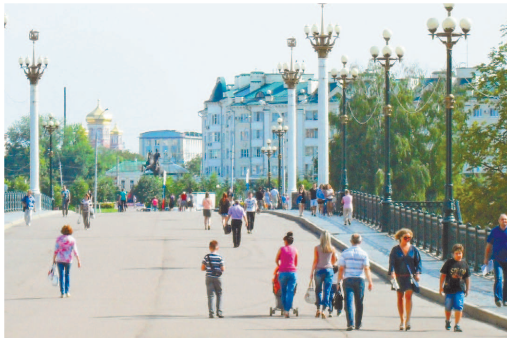
Минус всех праздников — быстро заканчиваются. Отодвинутые в сторону проблемы занимают прежнее место и докучают своей нерешенностью. Что сегодня волнует орловцев? Этот вопрос я задала прохожим на центральной площади Орла.