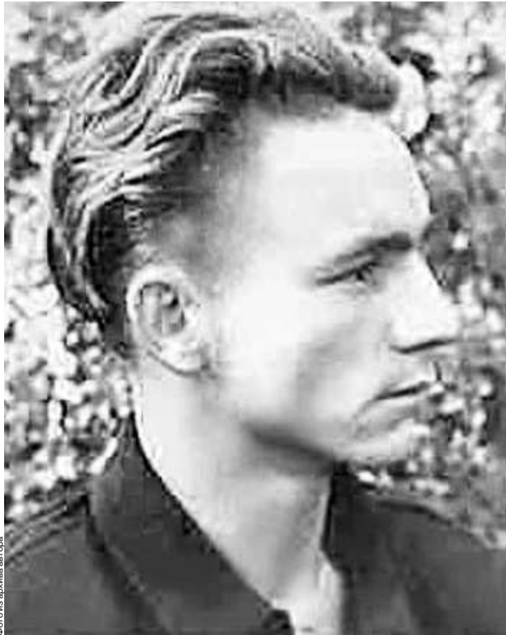
Таким был Николай Рыбников в юности

Через год и я была в Москве, так как поступила в