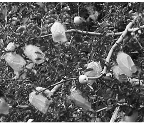
Мешочки из сетки на плодах — обычная картина для местных садов

Наделы у крестьян небольшие, как правило, 20—30 соток. У самых продвинутых да успешных участок может доходить до гектара. Но это редко. Работа-