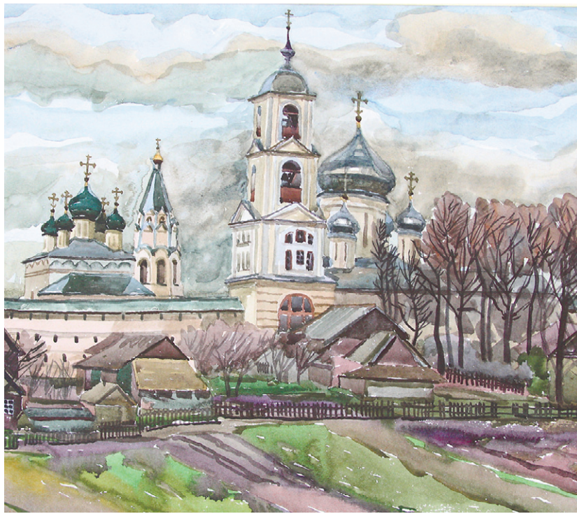
«Никитский мужской монастырь в Переславле-Залесском»

Поэтому нет ничего удивительного, что на гостевой странице сайта детской художественной школы Орла постоянно появляются вот