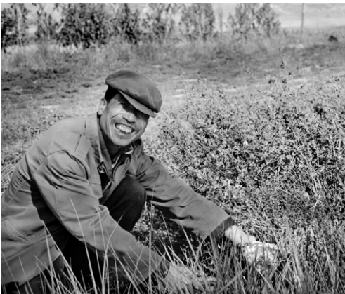
Крестьянин доволен: урожай будет добрый!

ют много. Работают хорошо. Набор приёмов и методов, так же как разнообразие техники, учёту не поддаются. Маленьких тракторишек, плугов двухлемеховых, сенокосов четырёх-пятирядных, молотильных агрегатов, разных других механизмов в избытке. Однако больших современных комбайнов, как в Европе или в России, в этих местах не увидишь. На этих мелких участках они ни к чему. Кукурузу, сорго, пшеницу во время уборки часто ставят в снопы, так делали наши бабушки лет 80—100 назад. При всём этом потерь почти нет, урожаи той же озимой пшеницы превышают сотню центнеров с гектара. Семена для сева используют лучшие, за этим следит специальная семеноводческая ассоциация, класть в землю абы какой семенной материал не позволит.