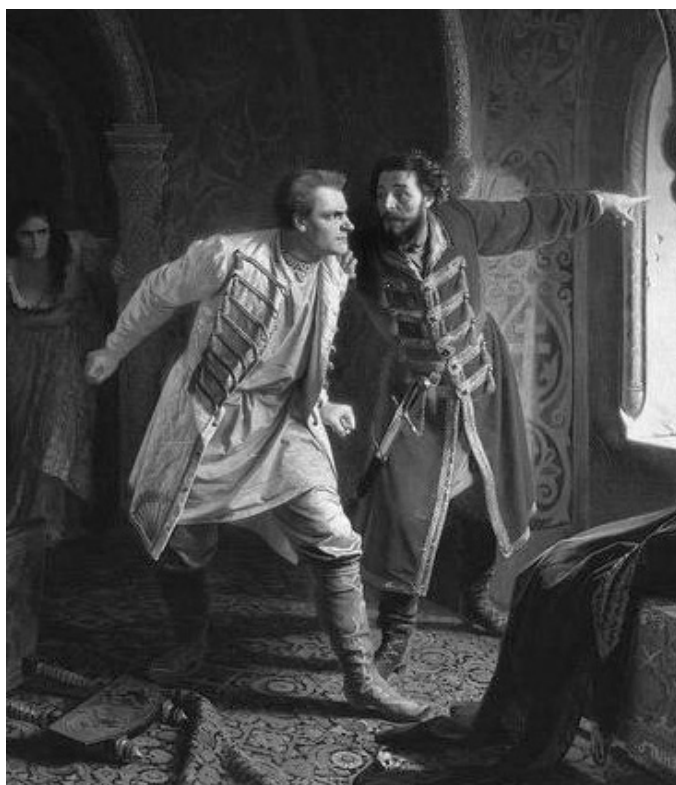
Смерть Григория Отрепьева, 1606 год, май

как писал патриарх; про него сказывают, что всё начинает молитвою по-православному».