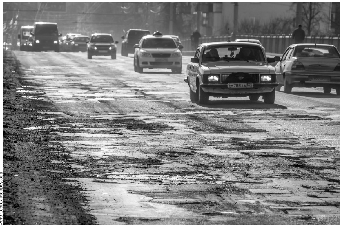
На герценском мосту асфальт сошёл вместе со снегом

Предусмотрена разработка проектно-сметной документации на строительство 50 км сельских дорог, реконструкцию аварийного моста на автодороге Вахново — Важкова в Ли-