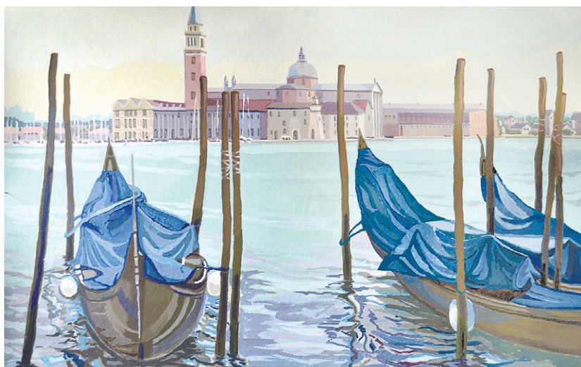
«Утро в Венеции». 2015 г.