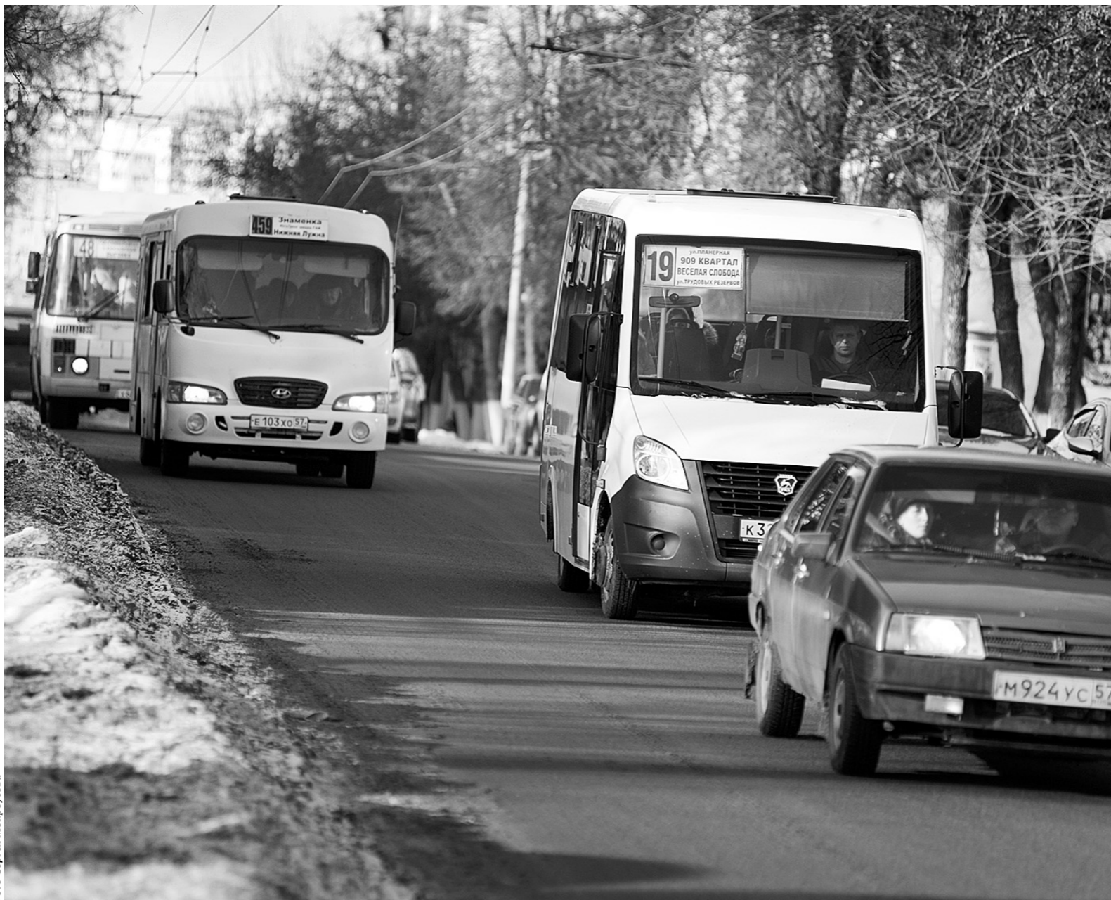
Большее всего претензий читатели высказали в адрес частных перевозчиков

Стоимость общегражданских проездных на ограниченный число поездок в любом виде транспорта, в том числе и в автобусе, не изменилась: 720 рублей за 60 по-