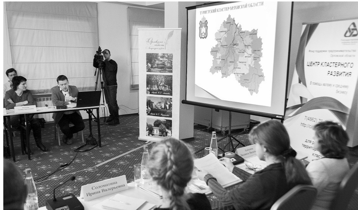
Участниками кластера внутреннего туризма стали уже 30 резидентов

Участниками кластера внутреннего туризма стали уже 30 резидентов, и список этот может пополниться включением