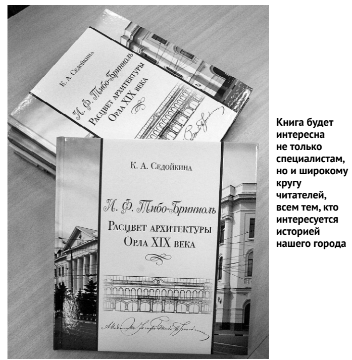
Книга будет интересна не только специалистам, но и широкому кругу читателей, всем тем, кто интересуется историей нашего города

Книга будет интересна не только специалистам, но и ши-