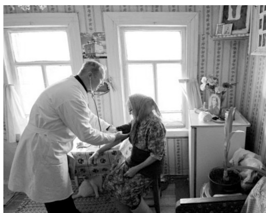
Ждёт деревня докторов

Были проанализированы все вопросы и обращения жителей Ливенского района. Выяснилось, что работой сельских медиков — как семейных врачей, так и фельдшеров ФАПов — люди в целом удовлетворены. Но материальная база сельских подразделений и городских служб Ливенской ЦРБ далека от идеала. И прежде всего требуется ремонт отделений стационаров ЦРБ. Жители хотят получать медпомощь в более комфортных условиях, пользуясь современным