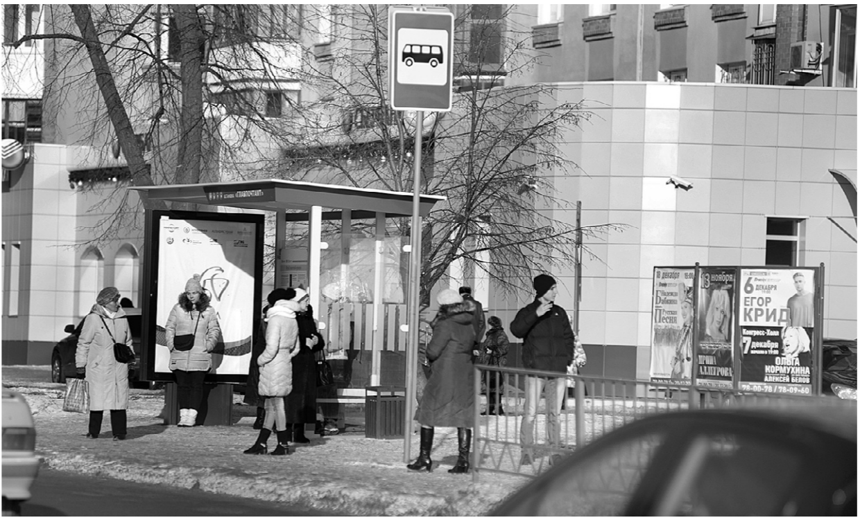
Скоро на городских остановках появятся табло с расписанием движения транспорта