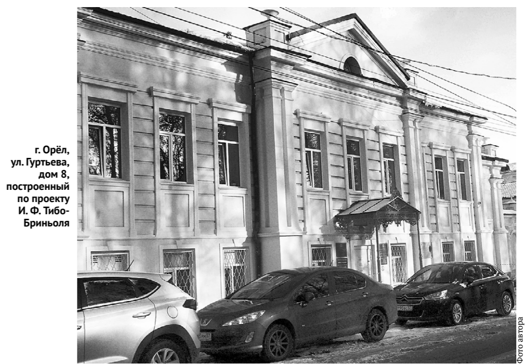
г. Орёл, ул. Гуртьева, дом 8, построенный по проекту И. Ф. Тибо-Бриньоля