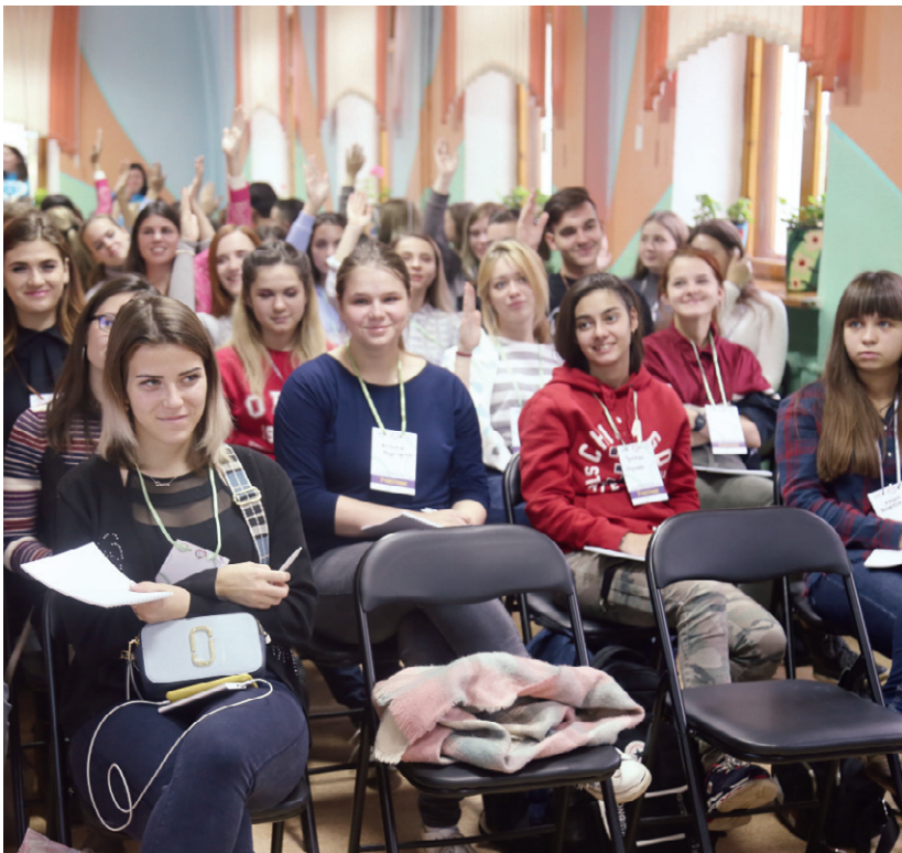
Волонтеры не говорят, а делают!