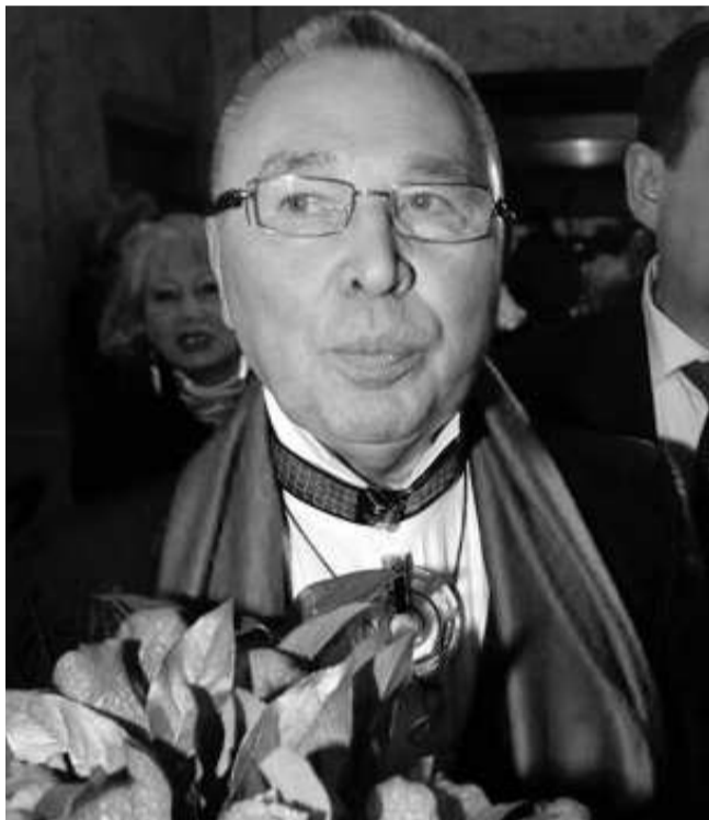
Vyacheslav Zaitsev в свои 75 полон сил

нужно не только для него лично, но и для его окружения, для его поклонников!