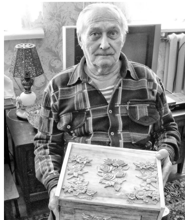
Резной ларец для сладостей — подарок супруге на 8 Марта

Дома хранятся только те вещи, которые для любимой супруги смастерил: шкатулки резные, светильник, часы-сова, ключница.