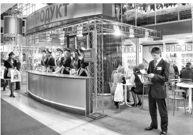
Стенд компании «Главпродукт» на международной выставке «Продэкспо»

Мясные консервы — говядина тушеная, тефтели в томатном соусе, паштеты, каши с мясом — получили высокую оценку международного дегустационного конкурса «Лучший продукт-2013» и были награжде-