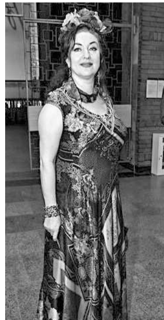
Тамара Гвердцители в платье от Вячеслава Зайцева

В шоу приняли участие многочисленные звезды эстрады. Первой выступила Надежда Бабкина со своим ансамблем