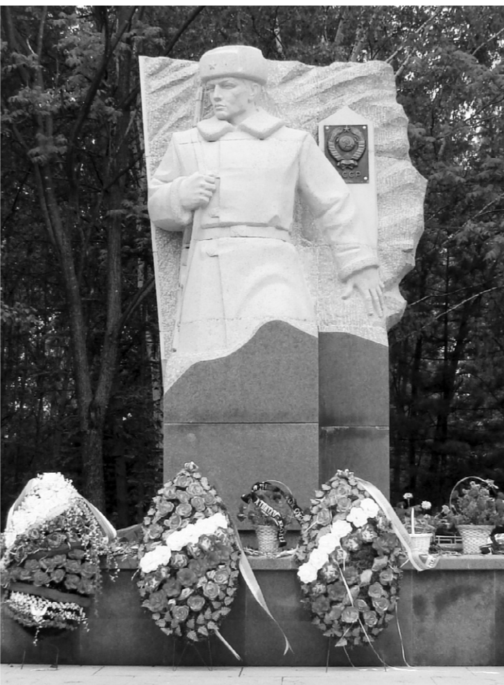
Мемориал в г. Дальнереченске

К тому времени обострилась ситуация на советско-китайской границе, приведшая в марте 1969 года к вооружённому конфликту на острове Даманский. Его причиной принято считать территориальные притязания Китая на часть советской территории. Многочисленные провокации со стороны китайских военнослужащих и гражданских лиц, нарушение ими государственной границы СССР встречали достойный отпор со стороны наших пограничников и заканчивались выдворением нарушителей с нашей территории. Оружие нашими войсками при этом никогда не применялось.