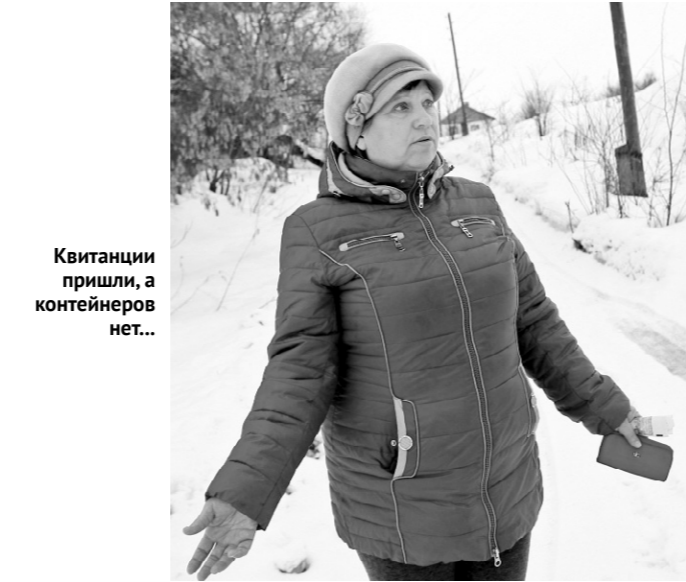
Квитанции пришли, а контейнеров нет...