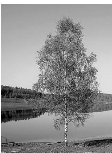
Вид на плотину на базе отдыха у д. Зубари.