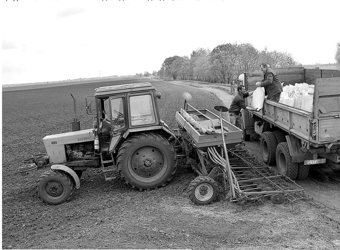
Сев конюшни в СПК "Победа Октября" (Хотынецкий район).

Подводя итоги поездки, губернатор сказал: "Если в целом охарактеризовать ход закончивающихся весенне-полевых работ в этом северо-западном направлении, то отмечу: земля разделана прекрасно,