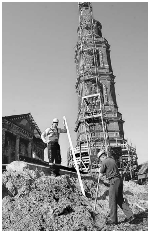
Колокольня Георгиевской церкви.

Удивительное дело, но и в самом городе Болхове, где у подножия самой высокой в