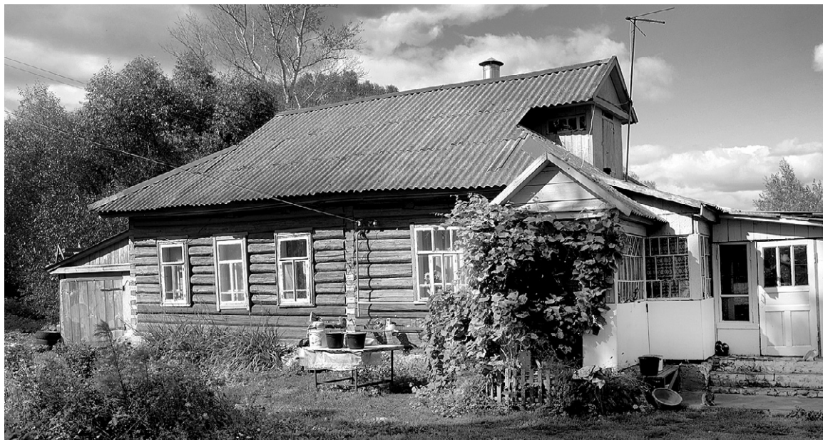
В Аболмазово живут в основном пенсионеры