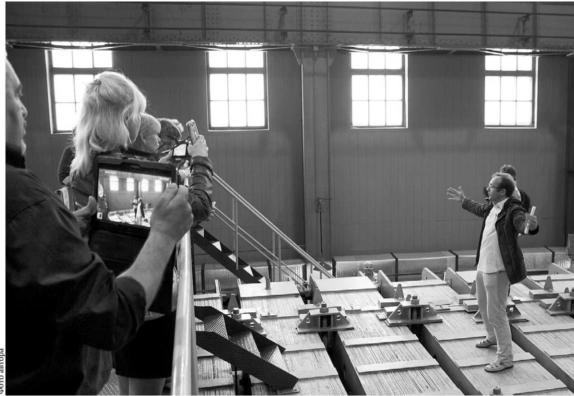
Диаметр магнита легендарного синхротрона достигает почти 60 метров, а вес равен 36 тысячам тонн

Примерно такой поверхностью информации я и обладал, когда вместе с коллегами из Москвы, Московской, Липецкой и Смоленской областей оказался в Дубне. Медиатур был устроен для региональных журналистов, вхо-