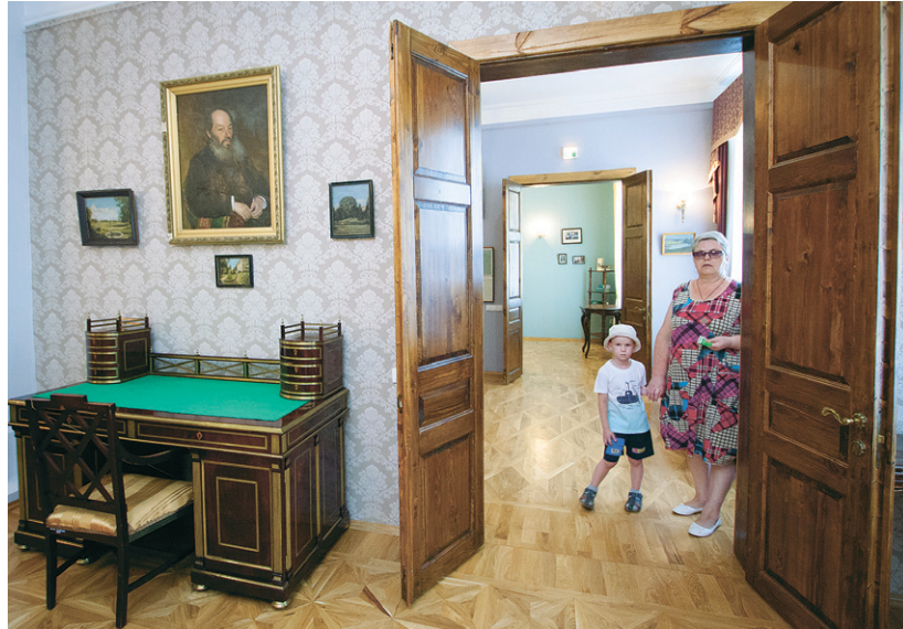
Музей писателей орловцев

Предусмотрено также стимулирование семейного посещения музеев, театров и иных культурных учреждений, в том числе через систему скидок и льгот. Помимо этого планируется по-