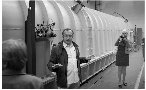
Дубна — город физиков