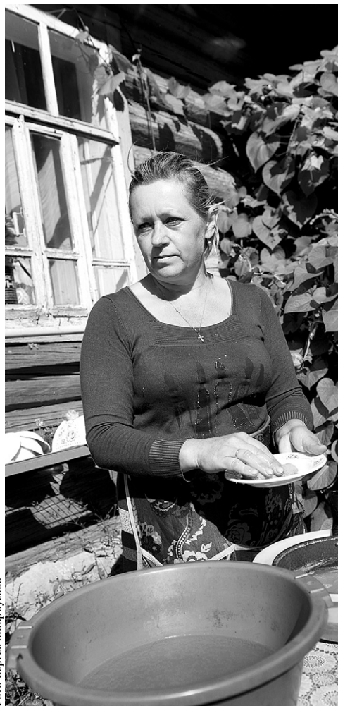
Посуду жители деревни моют в пластмассовых ёмкостях

Такие же собственные мини-колодцы есть у многих местных жителей, но полноценным водоснаб-