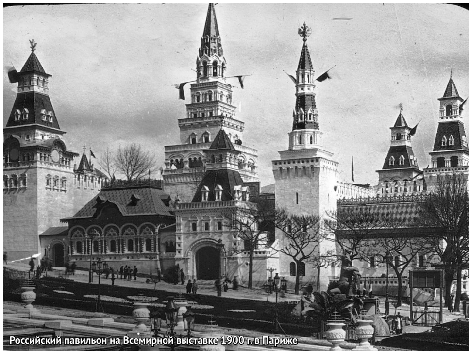
Российский павильон на Всемирной выставке 1900 г. в Париже