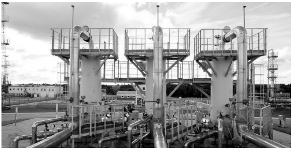
Суммарный объём инвестиций за 2005–2013 гг. по программе газификации регионов РФ ОАО «Газпром» составил порядка 214 млрд. рублей

— Замещение традиционного топлива на транспорте позволит, с одной стороны, расширить рынок сбыта природного газа, а с другой — избежать ро-