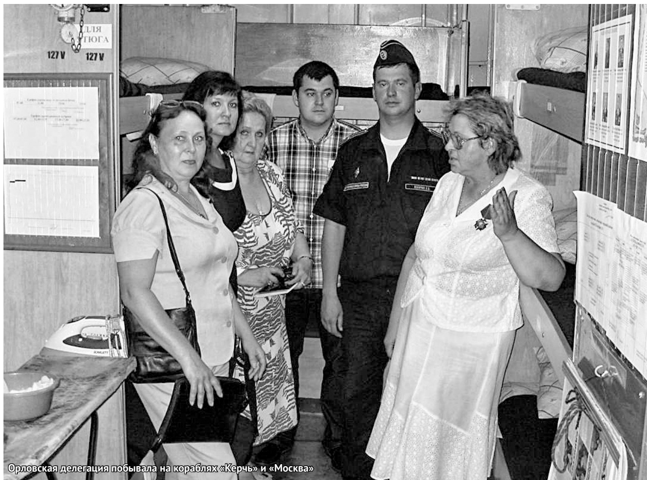
Орловская делегация побывала на кораблях «Керчь» и «Москва»