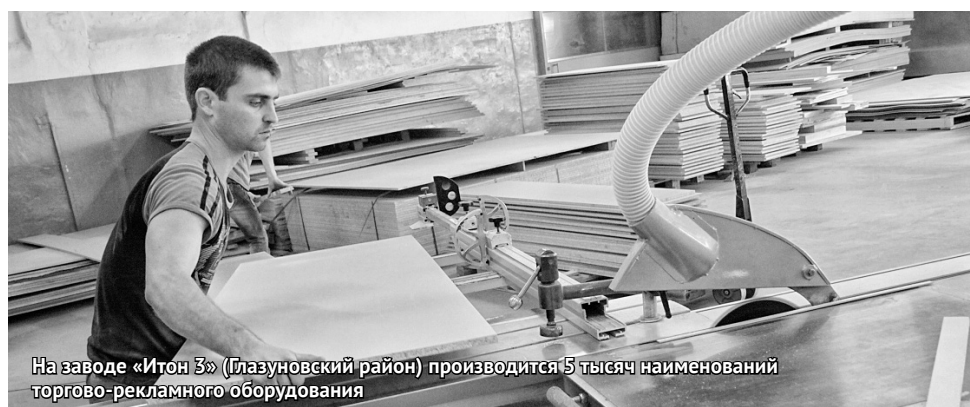
На заводе «Итон 3» (Глазуновский район) производится 5 тысяч наименований торгового-рекламного оборудования

Как доложил инвестор, предприятие даст работу