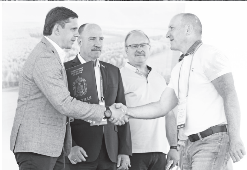
Во время награждения орловских аграриев

Затем состоялись осмотр опытных участков различных культур и гибридов, презентация перспективных селекционных разработок учёных ФНЦ ЗБК и других НИИ и научных центров, размещённых на площадке Шатиловской опытной станции. Андрей Клычков также ознакомился с экспозицией поставщиков сельскохозяйственной техники, ма-