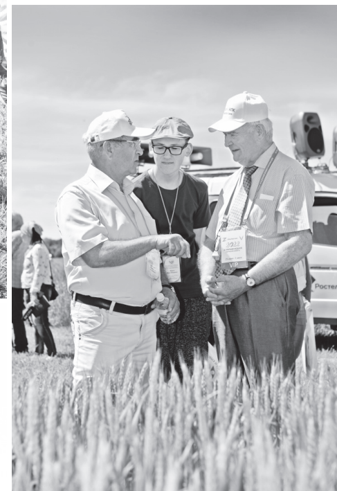
Учёные-селекционеры всегда найдут темы для обсуждения

30 июня работа Аграрной недели продолжилась в Орловском муниципальном округе, где состоялось торжественное открытие двух важных объектов: дилерского центра ООО «Комбайновый завод «Ростсельмаш» и селекционного и семеноводческого центра по зерновым культурам и сое ООО НПО «Бета-гран Семена».