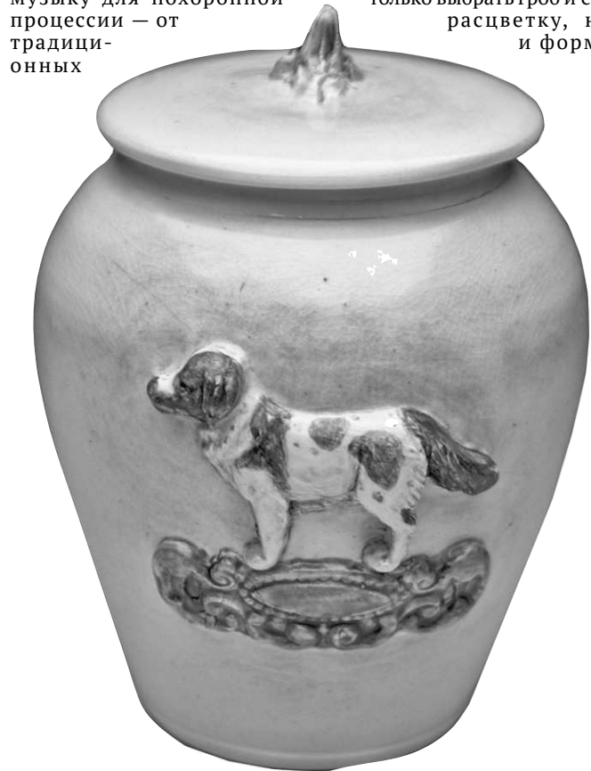
Ритуальщики осваивают новые услуги: теперь даже можно кремировать любимого песика

Большие перемены в ритуальной индустрии города видны сразу. Во-первых, любой желающий в онлайн-режиме на сайте компаний может не только выбрать гроб и его расцветку, но и форму