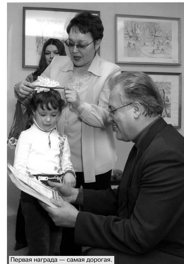
Первая награда — самая дорогая.