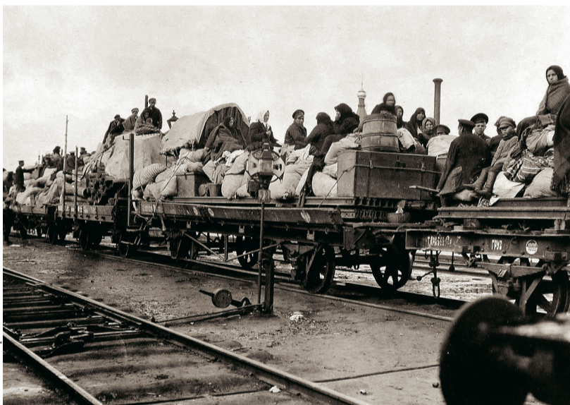
Летом 1915 года в Орёл ежедневно приходило два-три поезда с беженцами

В октябре губернатору поступило письмо от уполномоченного особого отдела по регистрации бежен-