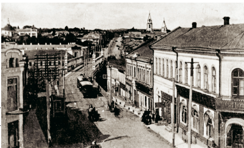
Улица Болховская в Орле, где располагалось орловское отделение Татьянинского комитета

цев при Татьянинском комитете о предоставлении Центральному всероссийскому бюро по регистрации беженцев списка местных организаций, обслуживающих нужды беженцев, и списка эвакуированных «общественных и частных учреждений». Переписка по