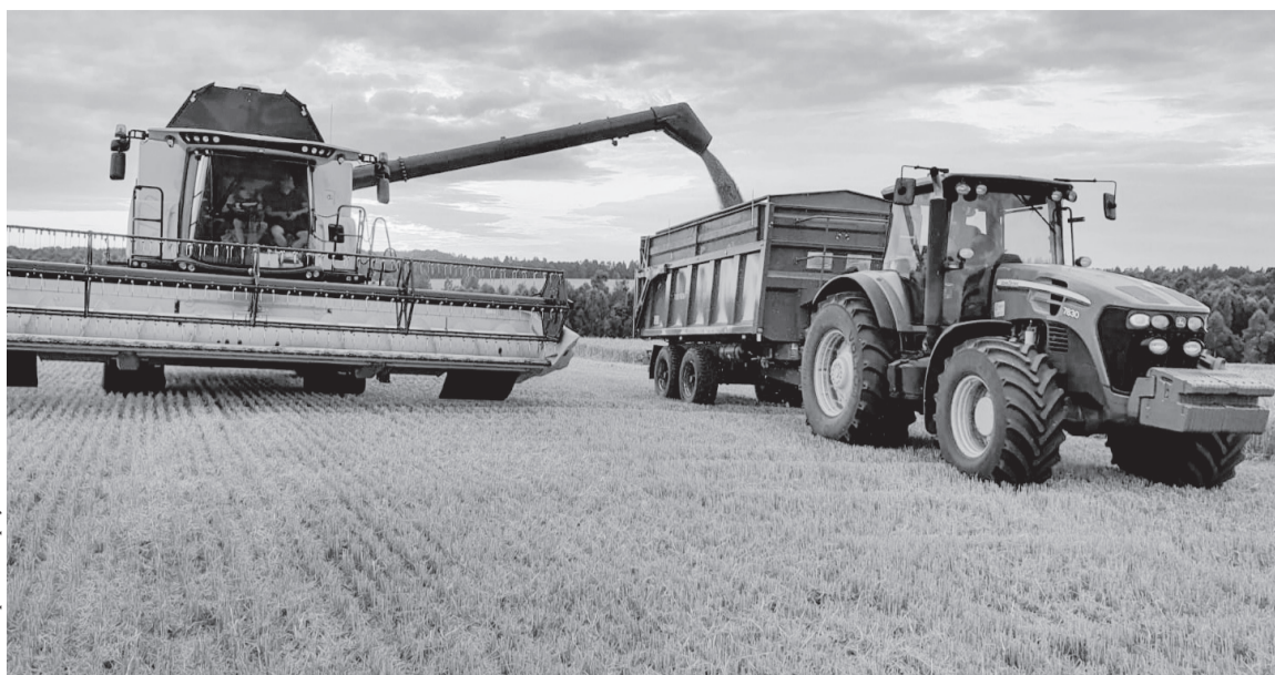
Год был непростым, но без хлеба не будем!