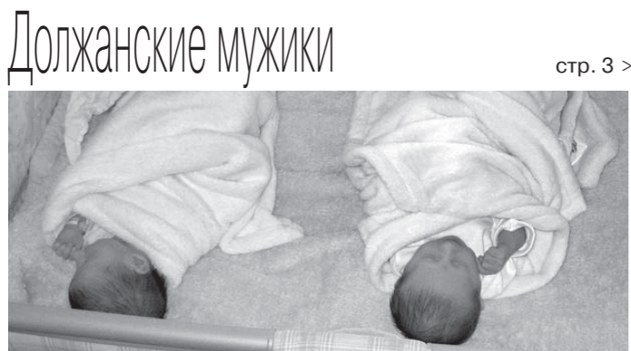
Должанские мужики стр. 3 >

Отвечили рублём СЕМЬ ДЕЛ ОБ АДМИНИСТРАТИВНЫХ ПРАВОНАРУШЕНИЯХ ВОЗБУЖДЕНО ОРЛОВСКИМ ТРАНСПОРТНЫМ ПРОКУРОРОМ стр. 2 >