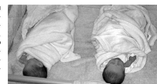
Малыши чувствуют себя хорошо, быстро набирают в весе