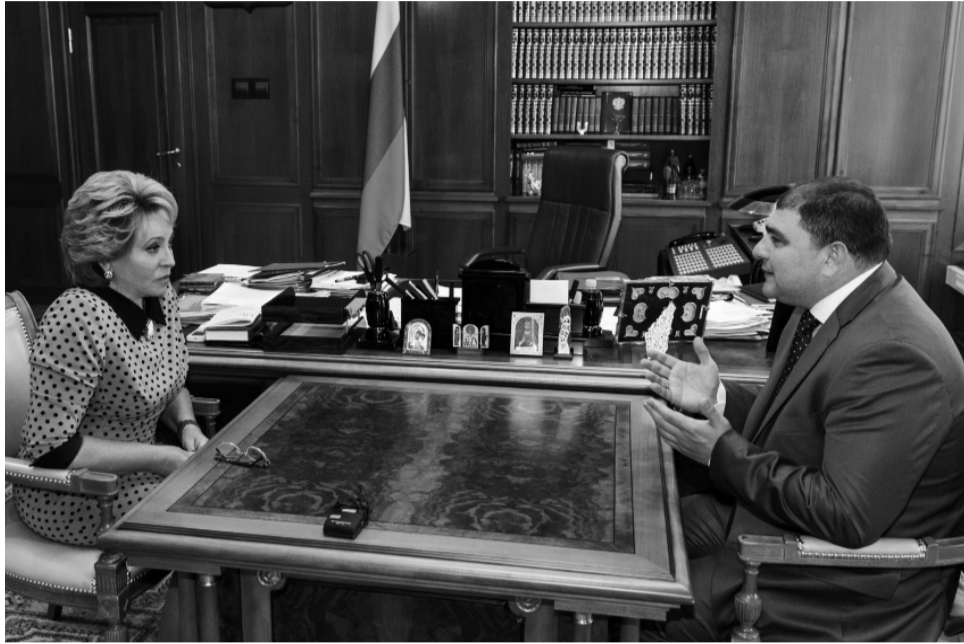
Валентина Матвиенко поинтересовалась ходом подготовки к торжественным мероприятиям. Как сообщил Вадим Потомский, реализуется масштабная программа подготовки к юбилею Орла.

Губернатор Орловской области пригласил спикера СФ посетить Орёл на празднование 450-летия основания города в августе 2016 года.