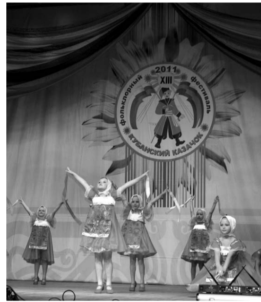
Орловцы покорили зрителей и судей

минации «Русский танец». А образцовый ансамбль танца «Росинка» из областного Дворца пионеров и школьников имени Ю.А. Ггарина успешно выступил на международном фестивале детского и юношеского творчества «Юла», собравшем коллективы из России, Украины, Казахстана. «Росинка» стала лауреатом фестиваля первой степени и получила специальный приз — пять бесплатных путевок на международный конкурс-фестиваль детского и юношеского творчества «Невские созвездия», который пройдет осенью в Санкт-Петербурге.