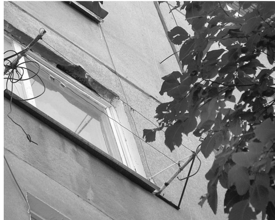
Спасительное дерево растёт у самого окна квартиры дома № 27