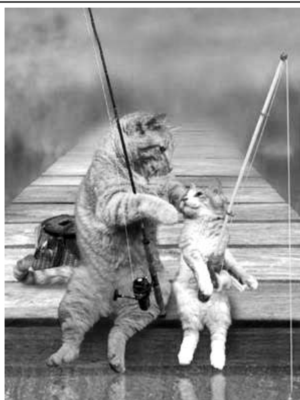
Наш адрес: 302000, г. Орел, ул. Брестская, 6, к. 33.

Муж с женой останавливаются перед витриной мехового магазина. У жены загораются глаза, и она нежным голосом говорит: — Вот такую шубу я хотела бы иметь! — Тогда тебе нужно было родиться норкой.