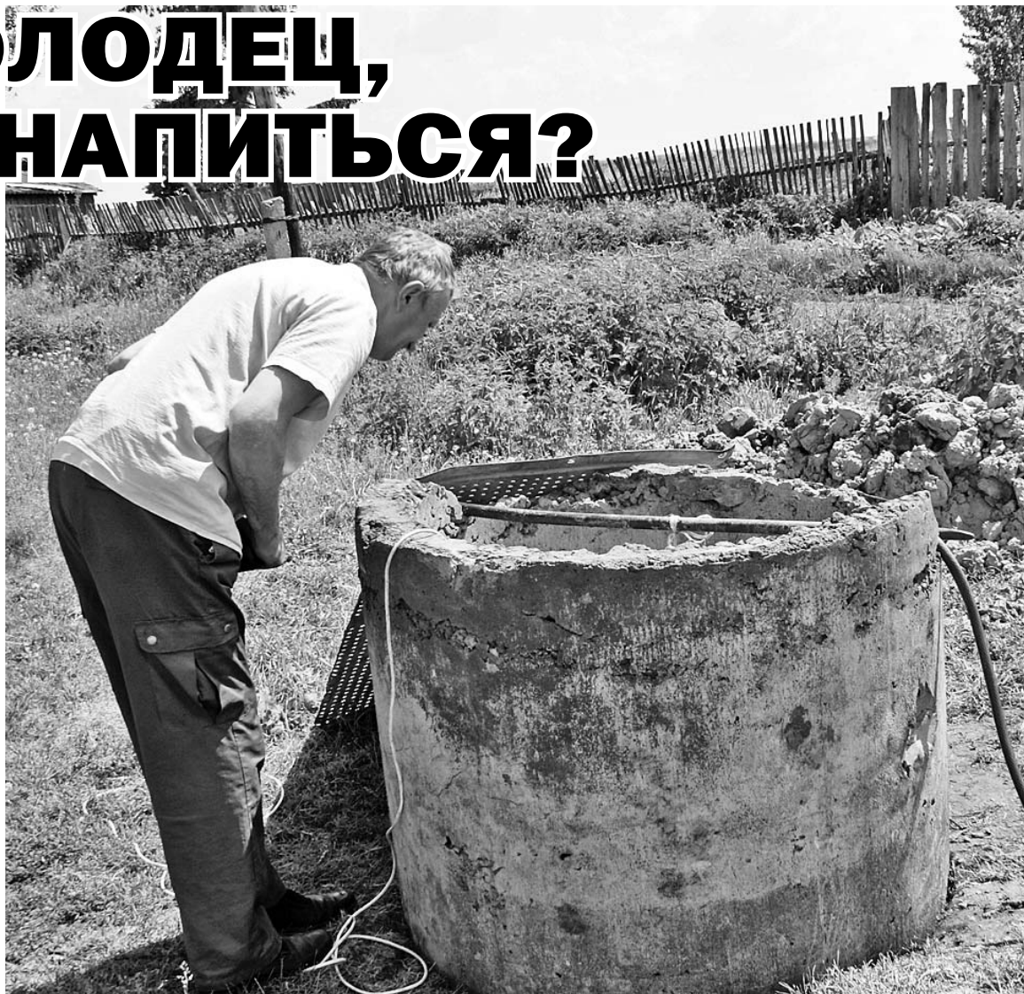
Будет ли жить новый колодец в д. Малое Юрьево?

— Мы к главе: «Когда ж ты колодец нам вернёшь? Пока ещё кто-нибудь не свалится?», — рассказывает одна из жительниц Малого Юрьево. — А он вместо того чтобы дело делать, совсем колодец закрыл. Сказал, что в другом месте поставим. Так вот мы всю