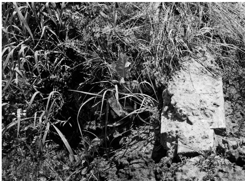
Засыпанный колодец в д. Башмаково.

— А кто делал заключение, что именно в этом месте надо копать, что здесь есть вода? — поинтересовались мы.