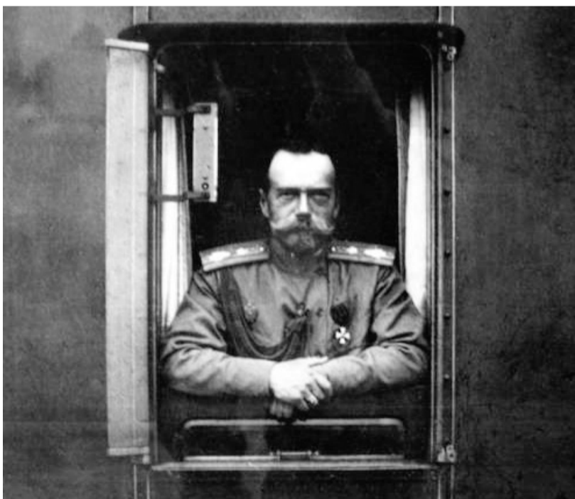
Император Николай II