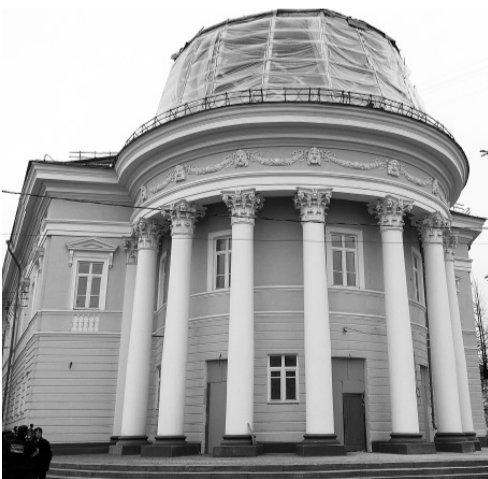
Скоро артисты «Свободного пространства» вернутся на родную сцену