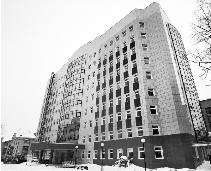
Новый корпус областной детской больницы откроется в марте