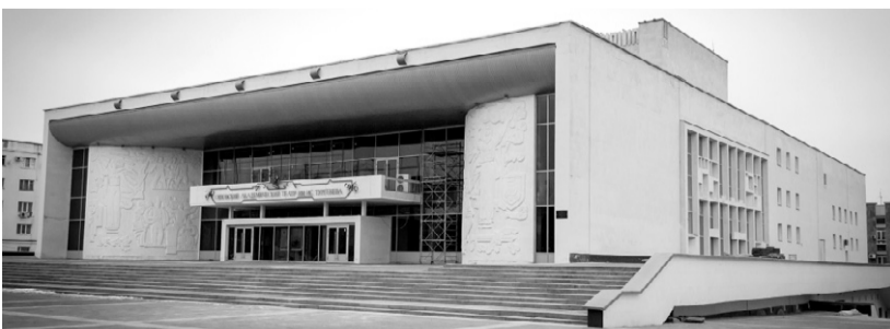
Открытие ОГАТ после реконструкции с нетерпением ждут и актёры, и зрители