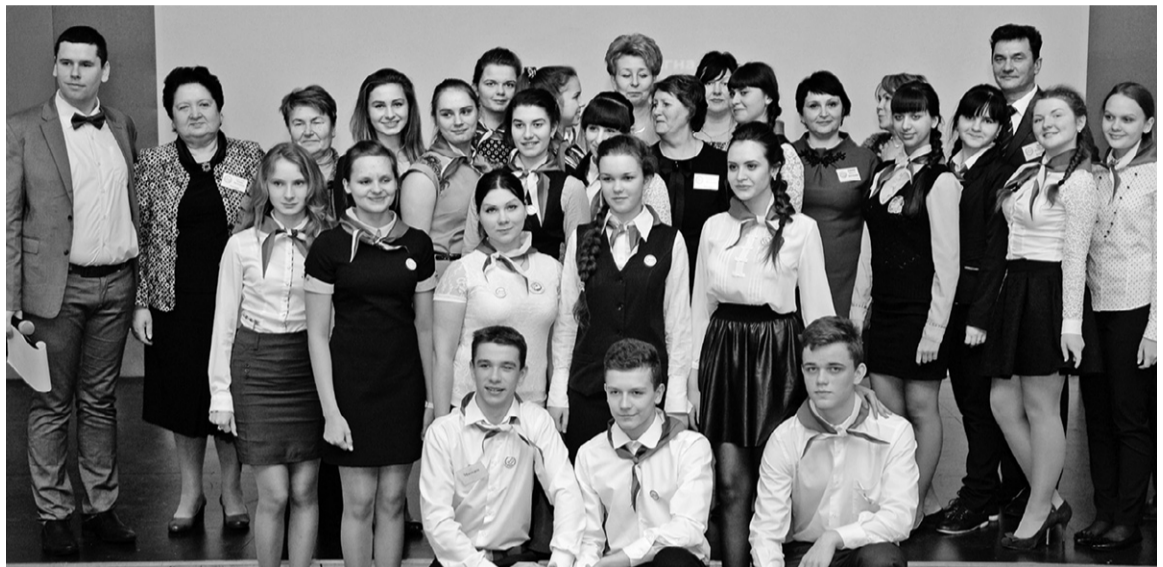
18 ребят из городов и районов Орловщины будут сражаться за звание ученика года

Выпускники готовились к конкурсу больше месяца. Самый сложным оказалось подготовить презентацию.