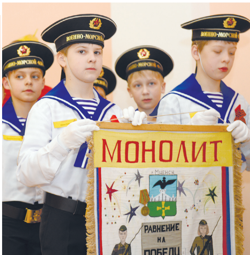
Мальчишки готовы защищать Родину наравне со взрослыми