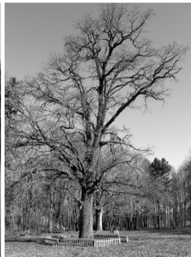
Дуб в усадьбе Хитрово, посаженный в середине XIX века