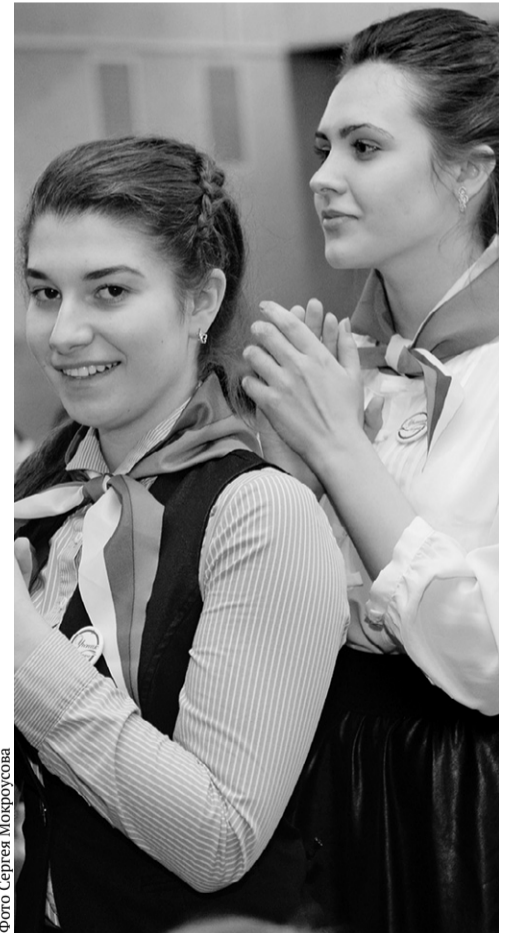
Конкурсантам предстоит нелёгкая творческая борьба

— Ребята, самый лучший ученик области дол-