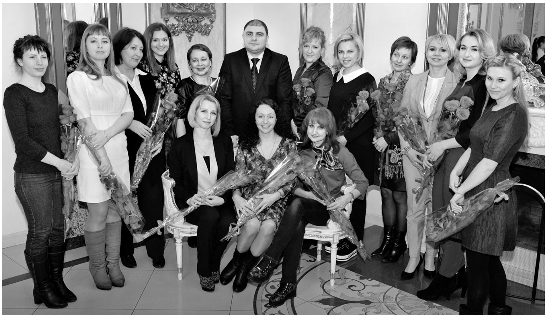
Орловским журналисткам — цветы от губернатора и фото на память

строить у нас завод по выпуску лекарств, которые позволят не ампутировать конечности у людей при сахарном диабете. Наш регион им привлекателен, тем более что отдельные привилегии появятся при создании особой экономической зоны, для открытия которой документы собраны на 95%. С 23 по 25 марта по приглашению президента Александра Лукашенко я выезжаю в Белоруссию по вопросам дальнейшего сотрудничества. Буквально на прошлой неделе у меня был посол Туркменистана — страны, которая сейчас занимает второе место в мире по запасам газа и нефти. Мы должны находить общие точки