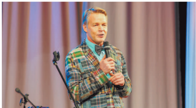
Актер театра и кино Александр Кузнецов

Они порадовали зрителей отрывками из спектаклей, веселыми скетчами, много пели, проявив недюжинный вокальный талант.