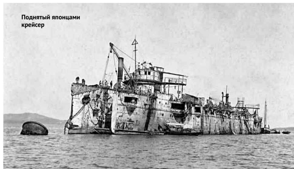
Поднятый японцами крейсер

— Первый раз я приехал в Россию, еще будучи студентом, примерно в 1969 году, а после мы регулярно приезжа-