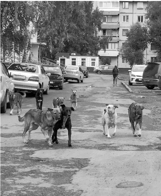
Бродячие животные в городе чувствуют себя хозяевами