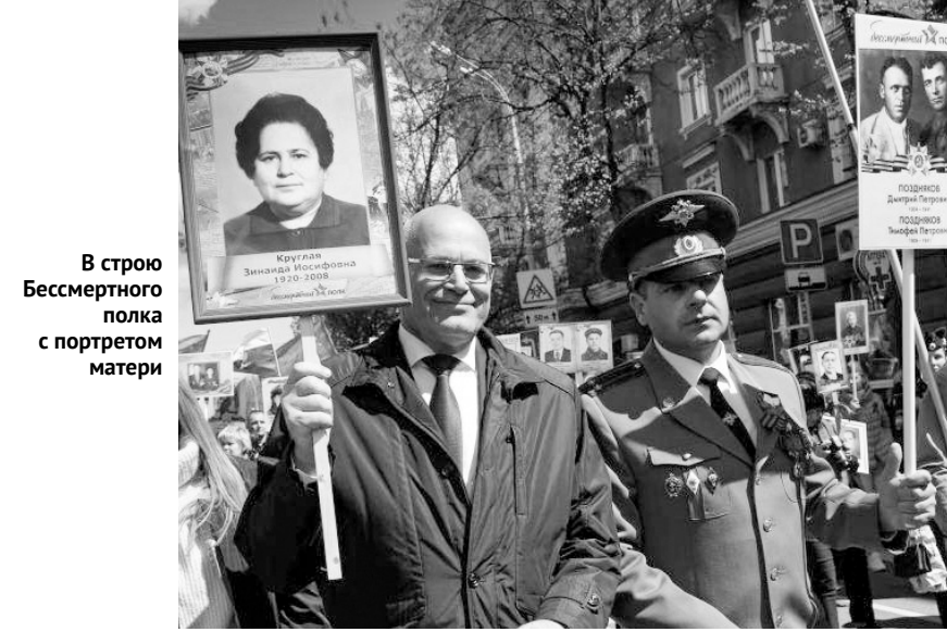
В строю Бессмертного полка с портретом матери