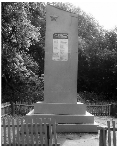
Памятник в Лопандино

Когда был достигнут западный берег, Тракта-