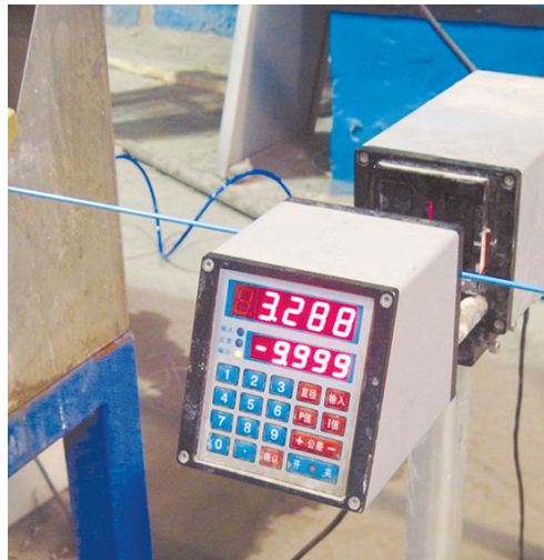
Точность измерения — залог качества

запланированные производственные мощности будут в эксплуатации. Сегодня мы уже выпускаем значительный ассортимент ка-