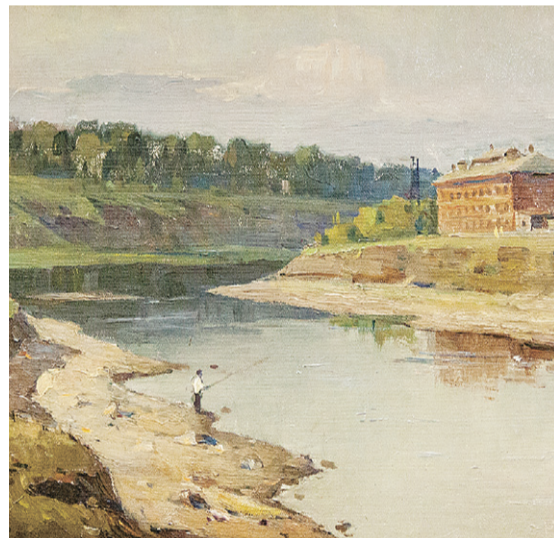
Г. Дышленко. «Меженные воды»

Картины взяты из фондов Орловского областного музея изобразительных искусств, областного краеведческого музея, Орловского объединённого государственного литературного музея И. С. Тургенева, а также частных коллекций.