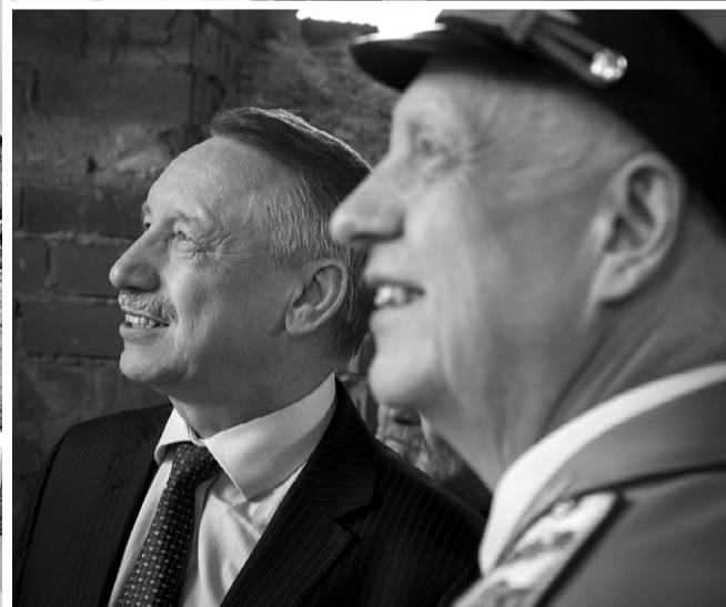
Вид храма не может не радовать