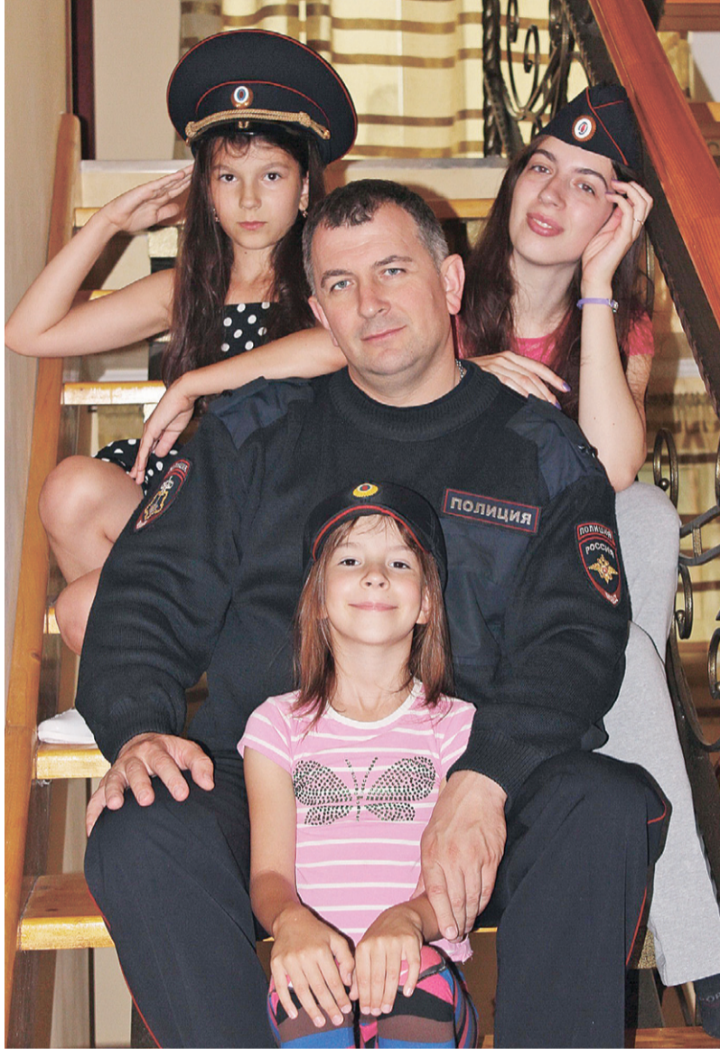
У прекрасного отца — отличная семья и замечательные дети