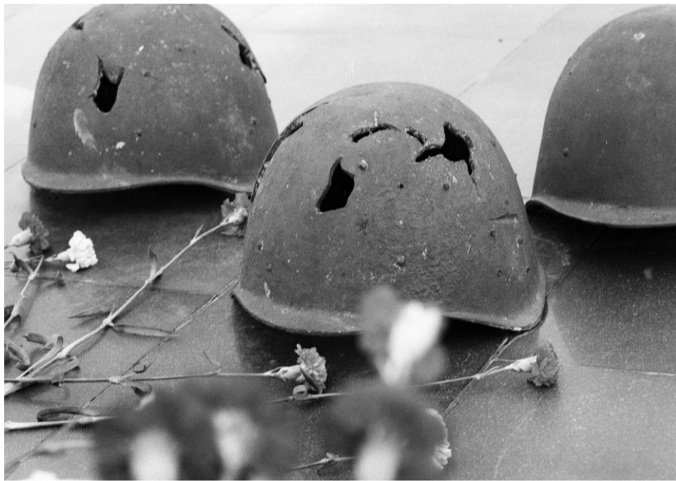
В этом месте найдены останки не только мирных жителей, но и красноармейцев

Бойцы межрегионального поискового объединения «Костёр» приступили к раскопкам в окрестностях д. Малая Гать на местах массовых убийств мирных жителей, совершённых фашистами во время оккупации Орловской области в 1941—1943 годах