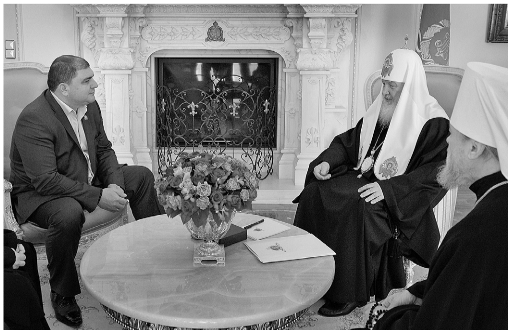
Встреча в резиденции Патриарха