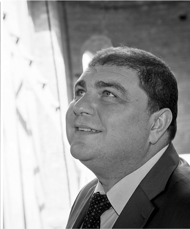
Губернатор доволен: качество работ отменное