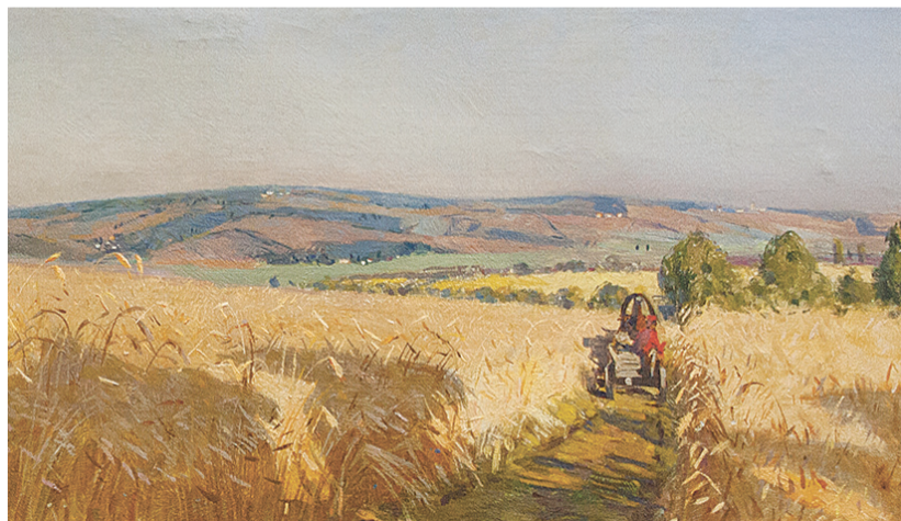
А. Курнаков. «Дорога на реку Зушу через ржаное поле»

«Снегопад в Орле» и «Дорога на реку Зушу через ржаное поле» Андрея Курнакова, «У полустанка»