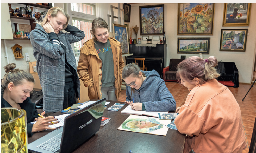
Творческие моменты в «квартале художников»

— Хотелось бы видеть в современном концепте галереи лекции по истории искусств, квесты для детей