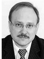
Василий Иконников, член Совета Федерации ФС РФ:

В. Ю. КОЧКАРЕВ. Начальник Управления ФСБ России по Орловской области, генерал-майор