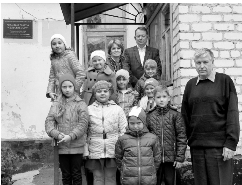
Юные ученики Троснянской средней общеобразовательной школы после экскурсии в редакцию районной газеты «Сельские зори» знают, как делается газета