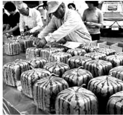
Реформы коснулись продуктов питания. Форму сменили, а как содержание? Л.К. Малина. г. Орел.