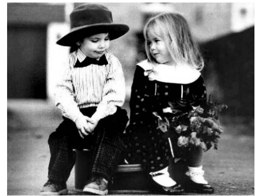
Чтоб тебе моделью быть, Нужно ноги удлинить. Л.А. Руденко. г. Орел.

Дорогие читатели! Напоминаем, что в конце июля мы подведем итоги конкурса первого полугодия и объявим имена его победителей.