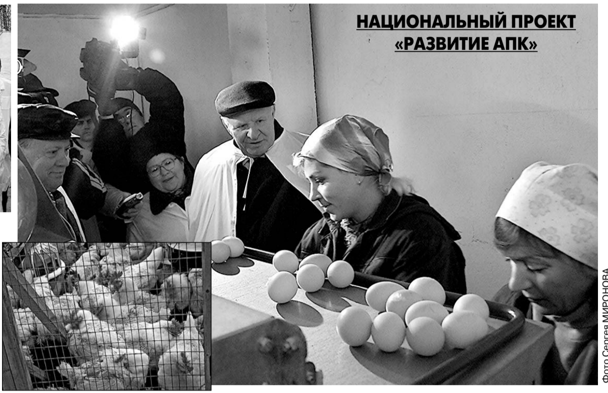
НАЦИОНАЛЬНЫЙ ПРОЕКТ «РАЗВИТИЕ АПК»

Вчера губернатор области Е.С. Строев совершил рабочую поездку в Мценский район. Здесь, в окрестностях сел Гантьерево и Жилино, орловская инвестиционная компания ОАО АПК "Орловская Нива" в рамках национального проекта "Развитие АПК" завершает реконструкцию животноводческих помещений под племрепродуктор по производству инкубационного яйца (мощностью около 10 млн. штук в год).