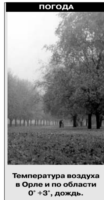
ПОГОДА Температура воздуха в Орле и по области 0° +3°, дождь.