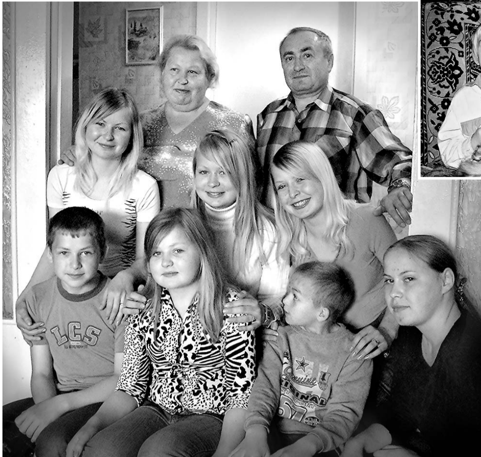
Крутятся, выживают. Дети одеты чисто, современно. Иной раз и мать с пониманием утешат: "Вон у тех — двое, а они ещё трудней нашего живут".