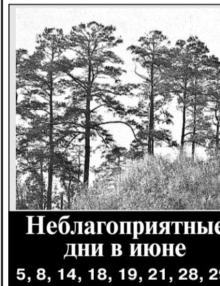
Неблагоприятные дни в июне

Стоимость слова в обычной телеграмме выросла на 16%, а в срочной — снижена на 13%. Таким образом, цена слова в обычной телеграмме составит 1,10 рубля, в срочной — 1,65 рубля.