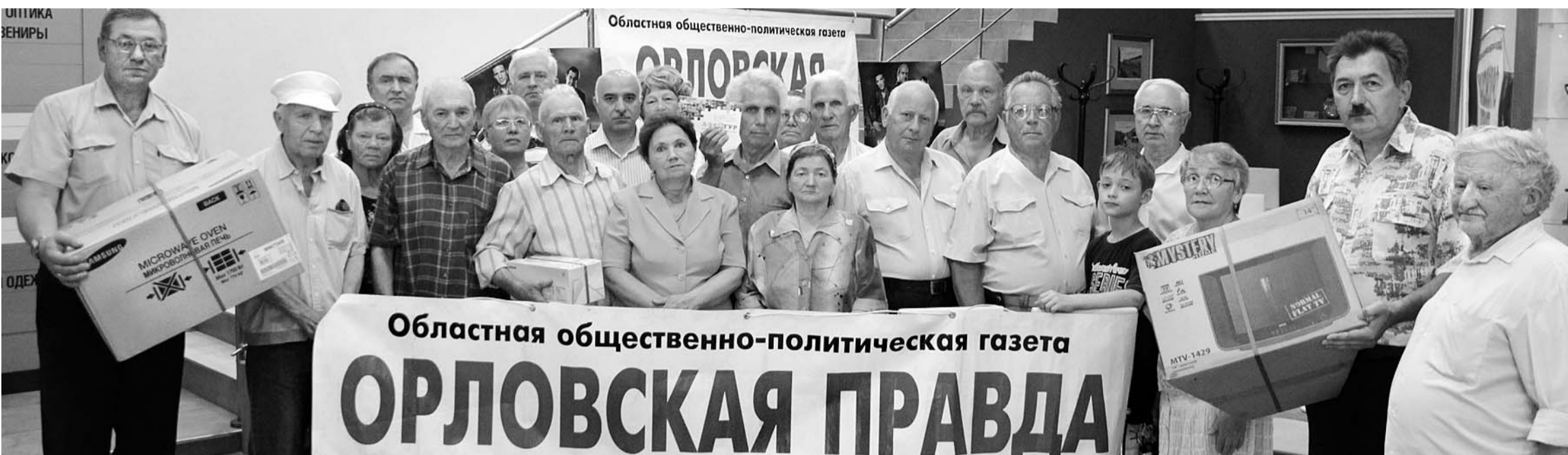
Сегодня у «Орловской правды» более 10 тысяч подписчиков. Каждая вторая семья выписывает газету более 20 лет кряду.

25 ИЮНЯ СОСТОЯЛСЯ РОЗЫГРЫШ ПРИЗОВ ДЛЯ ПОДПИСЧИКОВ «ОРЛОВСКОЙ ПРАВДЫ» — ГАЗЕТА БЛАГОДАРИЛА ПОСТОЯННЫХ ЧИТАТЕЛЕЙ И ВРУЧАЛА ПОДАРОКИ