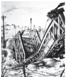
Разрушенный город в годы войны.