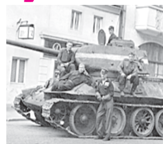
Ждали бойцов переправы и рвы, Медленно шли по лобастому кряжу. Танки раскраслены рче травы, Танки закутаны в хвойную пряху.

Армия шла по орловской земле Мимо развалин, заросших бурьяном, Рвов перекопанных, кладбищ в золь, Танков, потерянных Гудерианом.