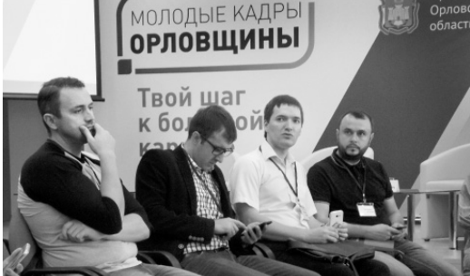
Тренинг — дело полезное