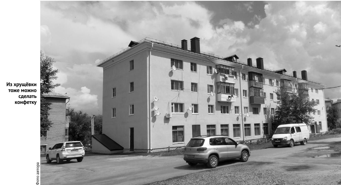
Из хрущёвки тоже можно сделать конфетку