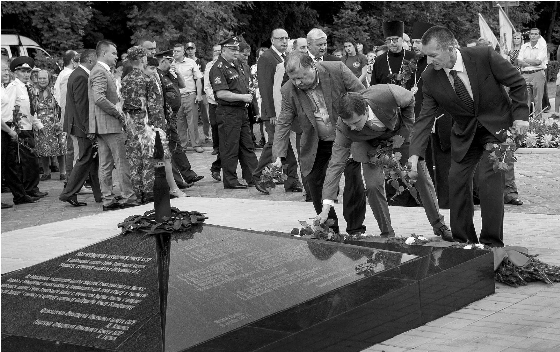
Живые цветы к мраморной плите и Вечному огню как символ нашей памяти

В Мценском районе отметили 100-летие со дня рождения Героя Советского Союза танкиста Ивана Любушкина и 75-летие освобождения города Мценска от немецко-фашистских захватчиков