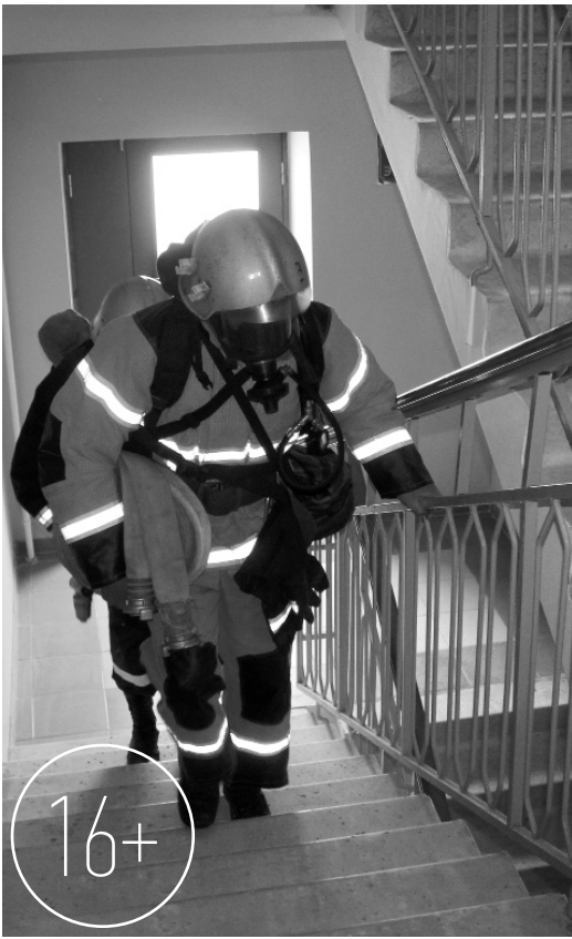
Главное спасателя — быстрота и отвага

Местом проведения соревнований стал 16-этажный дом на улице Лескова в Орле. Показать себя лучшим образом стремились участники каждой команды. Пока первая команда уходит со старта, вторая ждёт своей очереди. Никаких препятствий на пути нет. Самое главное пре-