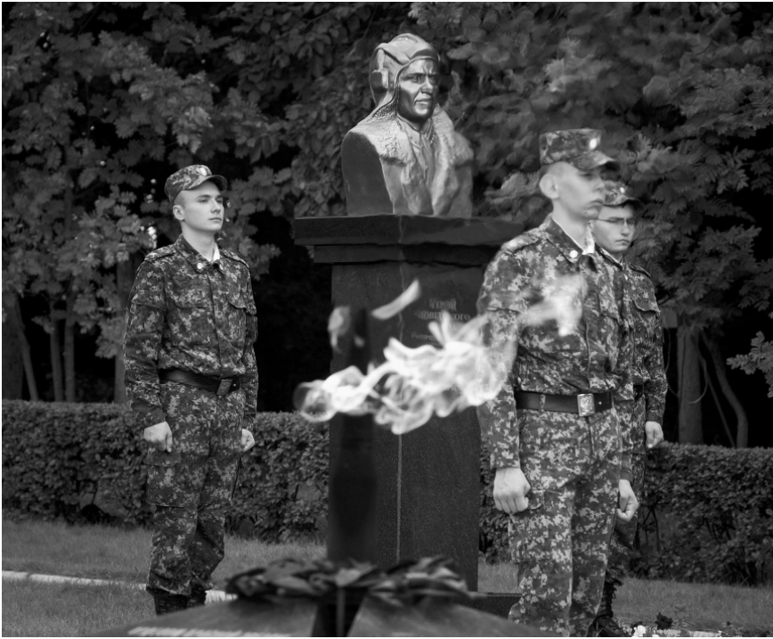
Почётный караул у бюста героя- танкиста Ивана Любушкина