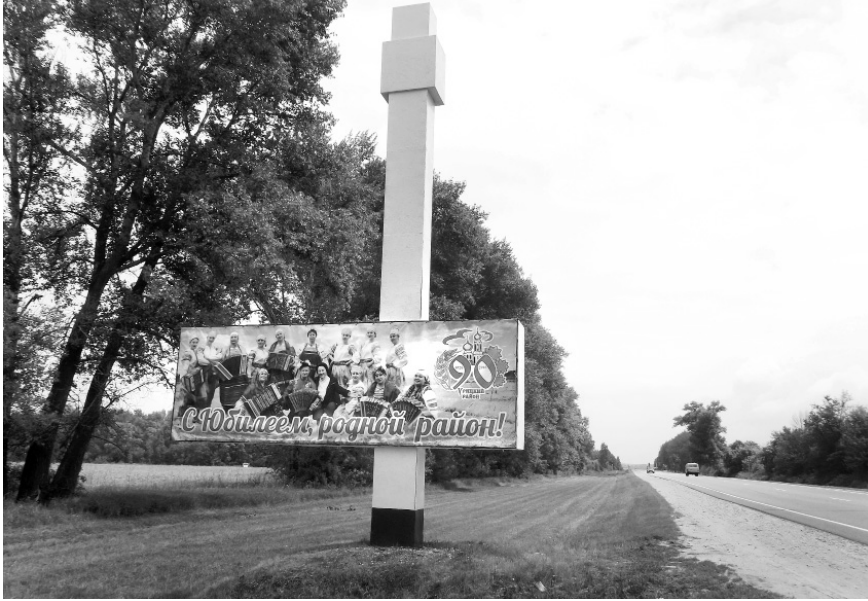
Родной район гордится своими артистами