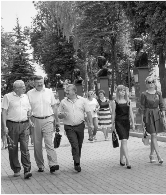
Мценск. Аллея Героев