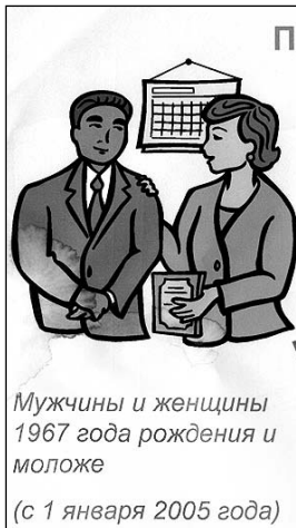
Мужчины и женщины 1967 года рождения и моложе (с 1 января 2005 года)

равления может привести к трехкратному росту сбережений через 16 лет, когда