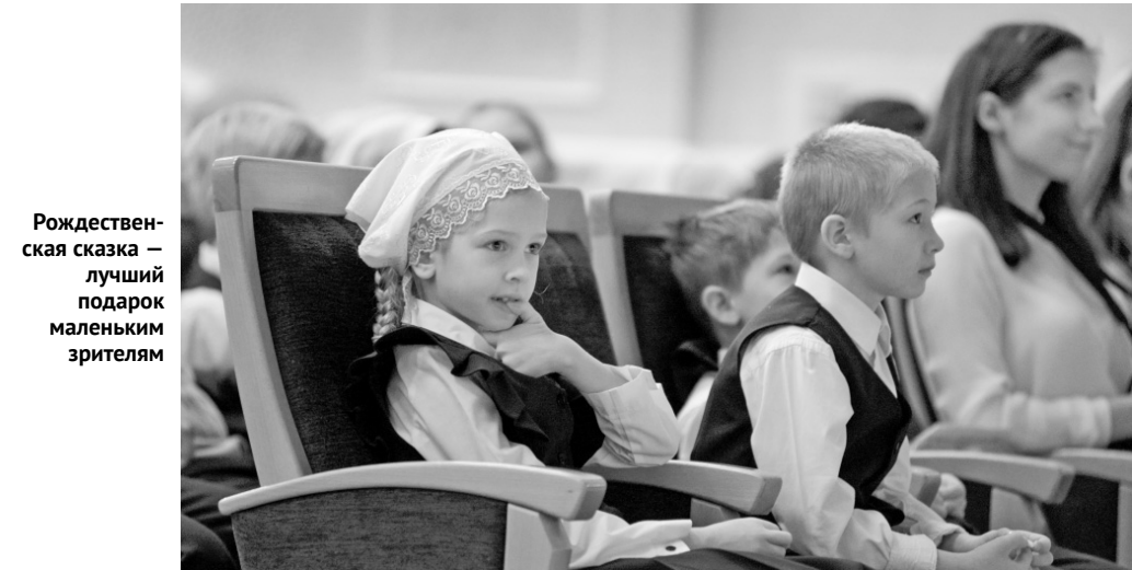
Рождественская сказка — лучший подарок маленьким зрителям