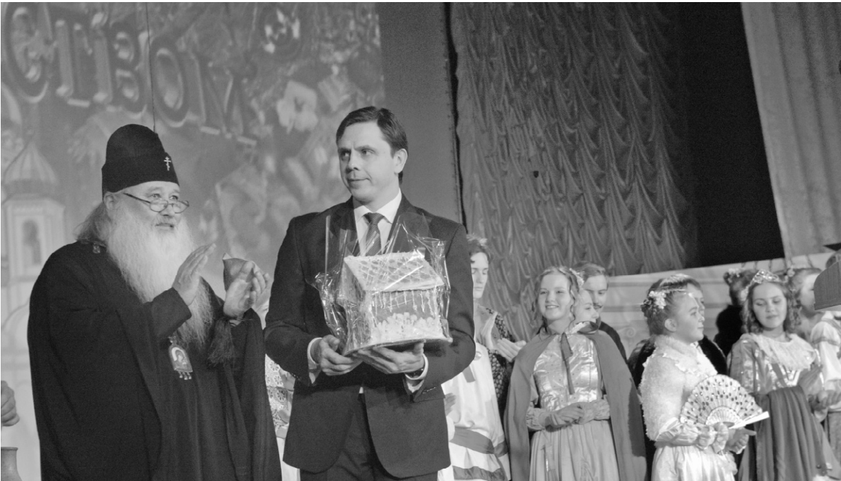
Сладкий домик в праздник Рождества