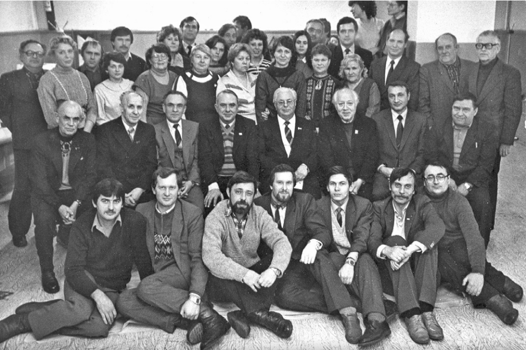
Коллектив редакции во время встречи Нового 1988 года

домствах и учебных заведениях, был участником событий, встречался с интереснейшими людьми. И были публикации самых разных жанров — от короткой, в три строки, заметки до больших очерков и аналитических статей.