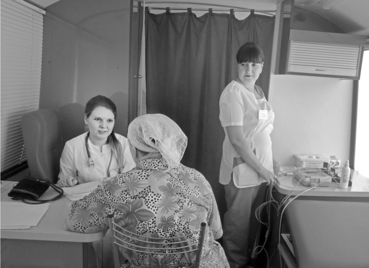
Передвижной ФАП приезжает в самые удаленные уголки Орловщины

Губернатор Андрей Клычков поручил продумать вопрос увеличения коечного фонда для паллиативных больных во всех больницах региона.