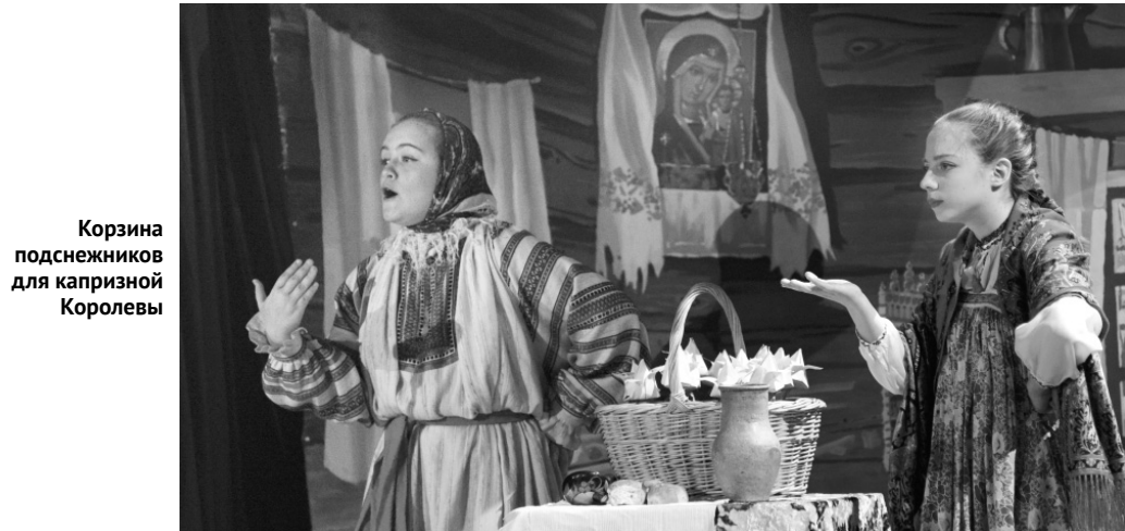
Корзина подснежников для капризной Королевы

В ОрёлГАУ им. Н. В. Парахина 11 января состоялся рождественский спектакль, подготовленный воспитанниками Орловской православной гимназии