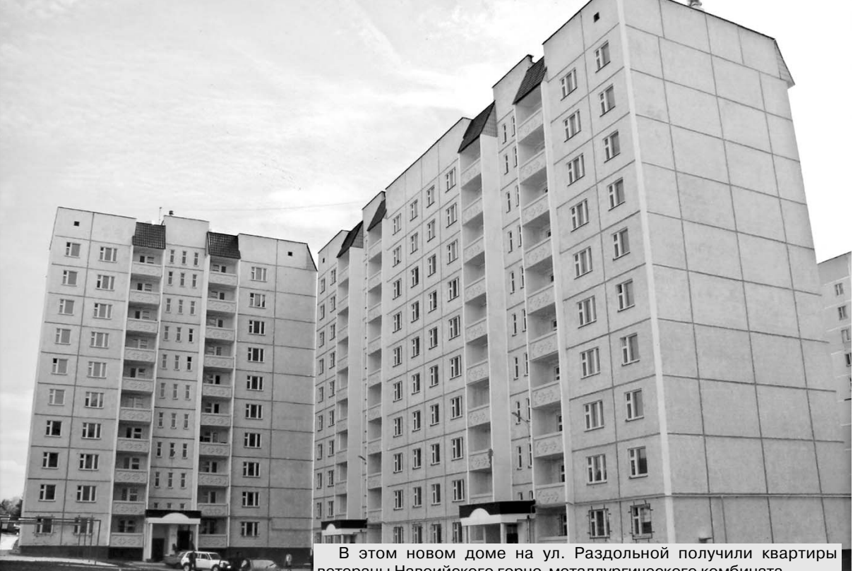
В этом новом доме на ул. Раздольной получили квартиры ветераны Навоийского горно-металлургического комбината.