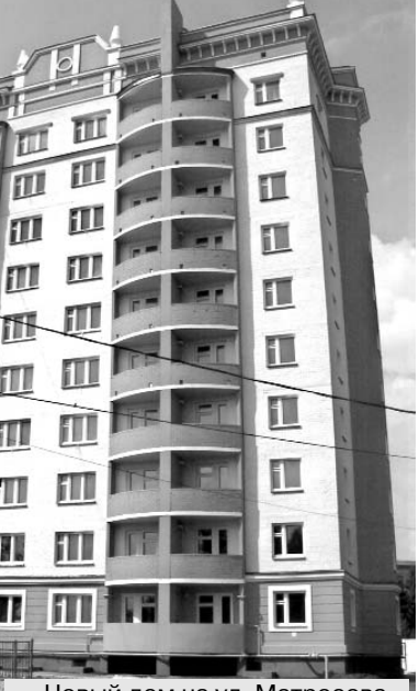
Новый дом на ул. Матросова.

— С первого апреля действует закон об участии в долевом строительстве, в котором прописан довольно объемный комплекс мер, защищающих дольщиков. Насколько трудно было наладить работу в соответствии с этим законом? — спросила я. — В центре "Развитие" всегда