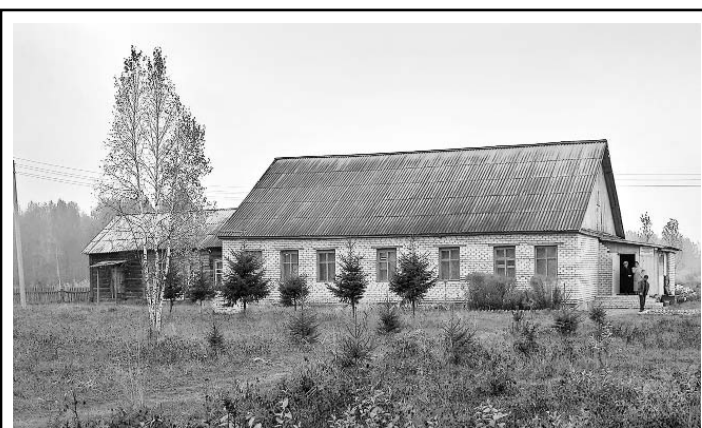
В тот вечер, 5 августа, деревенские ребята (ученики и выпускники Пешковской основной школы Знаменского района) были в Доме культуры, расположенном в нескольких десятках метров от здания школы.