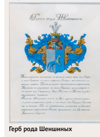
Герб рода Шеншиных

нужно, чтобы Россия выбралась из нищеты, стала процветающей страной.