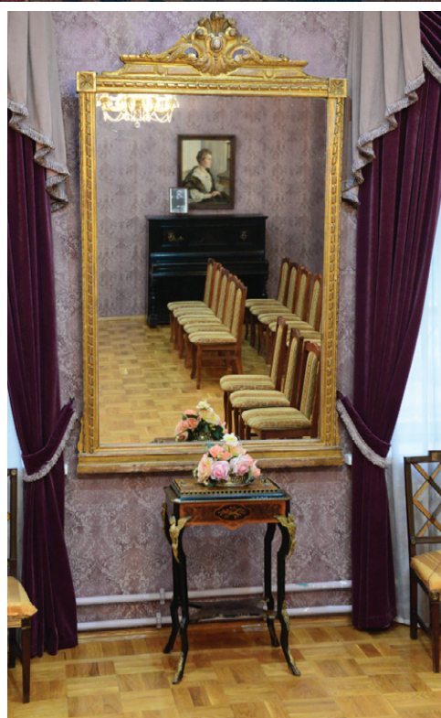
Подлинные вещи А. А. Фета, зеркало и жардиньерка, изысканны и великолепны

что он «намного выше своего времени, не сумевшего его оценить». Он понимал, что Фет — поэт будущего, что на его стихах будут учиться. Алексей Толстой как-то вспоминал, как однажды с женой они смотрели, кто из современных поэтов останется и кто забудется. И когда речь зашла о Фете, они в один голос воскликнули: «Останется, останется навсегда!»