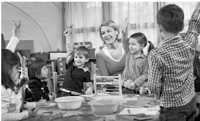
Задача не для детей: почему сотрудники детских садов, выполняя ту же работу, стали зарабатывать меньше?

Быстро проверка проводится, да не скоро дело делается. И в этом случае черепаший темпы вне-