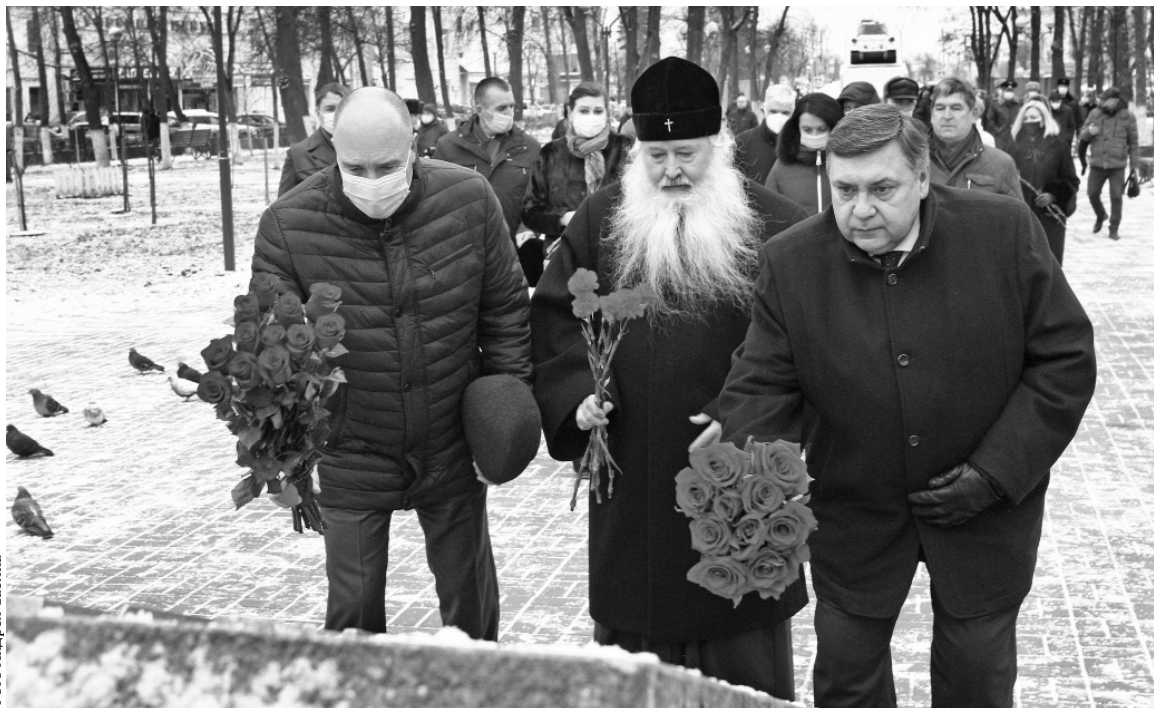
Живые цветы — дань памяти защитникам Родины

В Орле 3 декабря отметили День Неизвестного Солдата