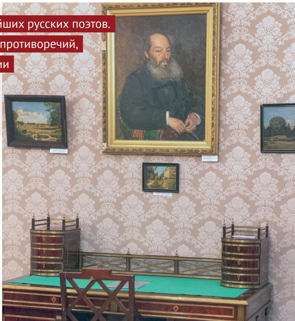
Уголок фетовского зала

Наверное, лучше всех из современников понял Фета Алексей Константинович Толстой. Он считал его поэтом «единственным в своём роде, не имеющим равного себе ни в одной литературе». Говорил,