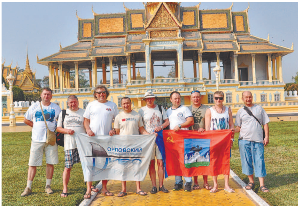
Орловские дайверы на территории королевского дворца в Пномпене

никакой непривычной для нас живности мы не увидели, хотя флора и фауна Южно-Китайского моря всё же отличается от животного и растительного мира Индийского океана и Красного моря.