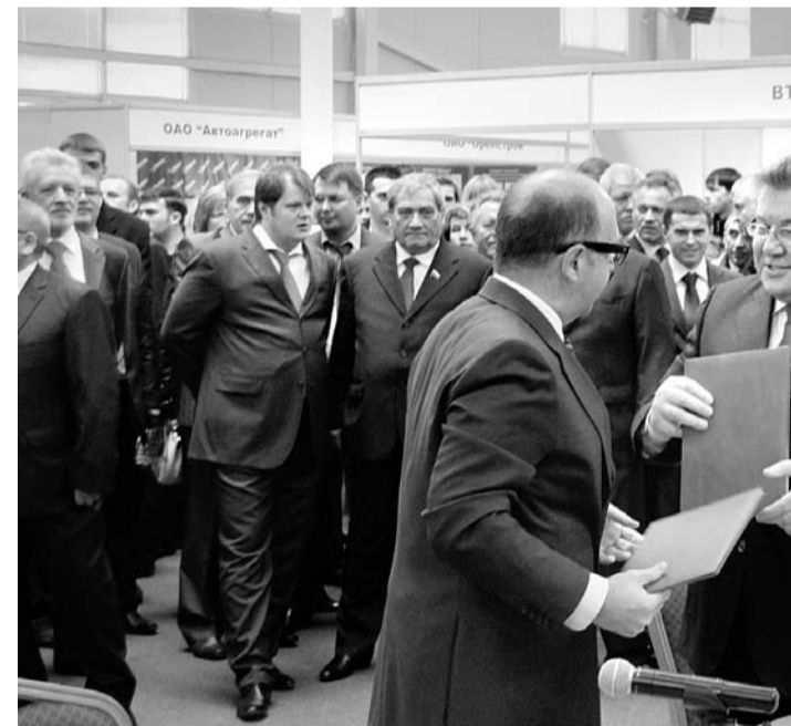
На II Орловском экономическом форуме, прошедшем 1 октября 2010 года, были подписаны инвестиционные соглашения более чем на 38 млрд. рублей.

«Можно подробнее о создании реальных проектов? Что ожидать от реализации инвестиционных проектов, соглашения по которым были подписаны на двух орловских экономических форумах?» — В 2009—2010 годах в Орловской области появились 24 новые компании, предлагающие новые проекты. Из них по итогам 2010 года к активной стадии реализации проектов приступили 15. Крупный проект, например, осуществляет компания «Орелстройтех» — по строитель-