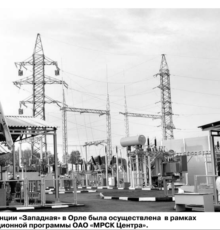
Реконструкция подстанции «Западная» в Орле была осуществлена в рамках инвестиционной программы ОАО «МРСК Центра».

«Можно подробнее о создании реальных проектов? Что ожидать от реализации инвестиционных проектов, соглашения по которым были подписаны на двух орловских экономических форумах?» — В 2009—2010 годах в Орловской области появились 24 новые компании, предлагающие новые проекты. Из них по итогам 2010 года к активной стадии реализации проектов приступили 15. Крупный проект, например, осуществляет компания «Орелстройтех» — по строитель-