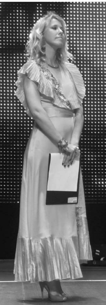
Весь вечер Ксения Собчак радовала молодежь своей раскованностью.