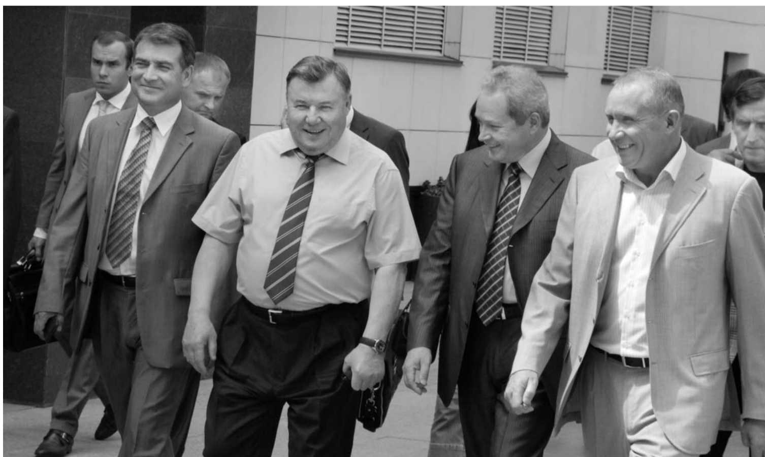
Губернатор Орловской области А.П. Козлов принимает министра регионального развития РФ В.Ф. Басаргина . Их сопровождают мэр г. Орла В.В. Сафьянов и директор мегакомплекса «ГринН» Н.Н. Грешилов .

ПОРЯДКА 20 МЛРД. РУБЛЕЙ ПЛАНИРУЮТ ОСВОИТЬ К 450-ЛЕТИЮ ГОРОДА