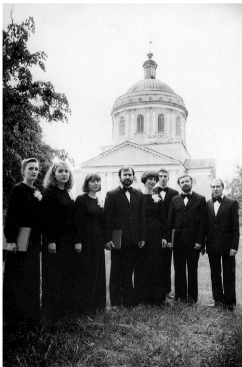
Ансамбль духовной музыки «Лик». 1990 г.

За это время коллектив накопил богатый репертуар