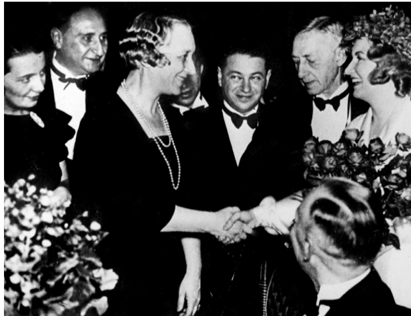
И. А. Бунин на церемонии вручения Нобелевской премии. Стокгольм, 1933 год